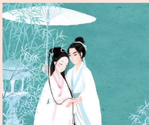
悲傷的時候，我們盡可以哭泣，然後迎接下一個天亮，下一場旅行。

因此，今天的青年男女，總是嚮往執子之手，與子偕老的愛情，海誓山盟總有別樣的魅力。沒在一起的時候想着能夠相愛，相愛之後想着一生一世，但兩情相悅容易，天荒地老卻不容易。在愛情裏受傷的人們，總是走到西湖邊，留下被現實折磨的淚水與關於過往的痛訴。在偌大的世界裏，相遇不容易，心心相印更是不易，當愛情破裂，最好是奔赴明天，破鏡重圓終究是夢裏黃粱，難以作數。