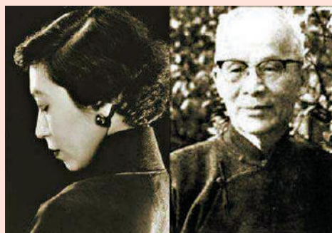
▲1944年胡蘭成給張愛玲婚書上寫了一句說話：「歲月靜好，現世安穩」，典出《詩經·鄭風·女曰雞鳴》。

體現了《詩經》緊貼現實，語言純樸，不尚雕琢而渾然天成的文學特色，帶有強烈的民生氣息和濃郁的鄉土情調，是淳樸生命和自然情感的真摯流露。