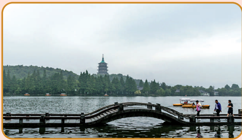
◀西湖是杭州的地標，遊人必到的打卡勝地。

白蛇傳的愛情之所以動人，主要在於它對愛情的自由追求與主動選擇具有別具一格的魅力。在中國的傳統觀念裏，