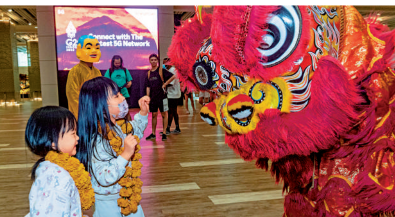
1月22日，在中國遊客與舞獅互動。

遇安排。2月10日出發的「肯尼亞10天」遊，既是肯尼亞重啟首團，又是南航廣州直飛內羅畢航線復航首團，該團遊客將享受肯尼亞官方旅遊歡迎儀式的首團禮遇；俄羅斯重啟首團預計將在2月16日出發，廣之旅聯合俄羅斯旅遊局推出重啟首團「三禮讚」和「四大禮遇」，包括官方機場接機歡迎儀式、官方歡迎晚宴。