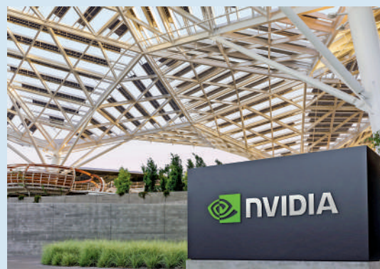
▲位於加州的英偉達總部外。

【大公報訊】綜合路透社、「湯姆硬件」網站報道：近日美國與日本、荷蘭達成協議，限制向中國出口製造先進半導體所需的設備。美國半導體行業協會（SIA）日前表示，美國對向中國出口芯片設限，可能會傷害美國整個半導體行業。美國政府對中國芯片等行業施加嚴格限制後，美國半導體公司市值在一夜間蒸發約2400億美元。包括電子設計自動化（EDA）工具開發商、芯片設計商、晶圓廠設備（WFE）生產商，以及芯片製造商本身都蒙受損失。SIA指出，美國半導體公司依賴於創新的良性循環，包括對研發和進