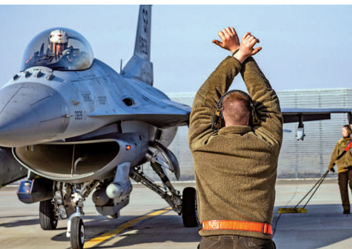
▲一名美軍士兵在羅馬尼亞一個軍事基地指揮F-16戰機。

俄媒稱，儘管美英德等國仍拒絕援烏戰機，但該議題已經逐漸演變為一個正在認真考慮的提議，這與早前是否援烏坦克的討論擁有相同的變化軌跡。