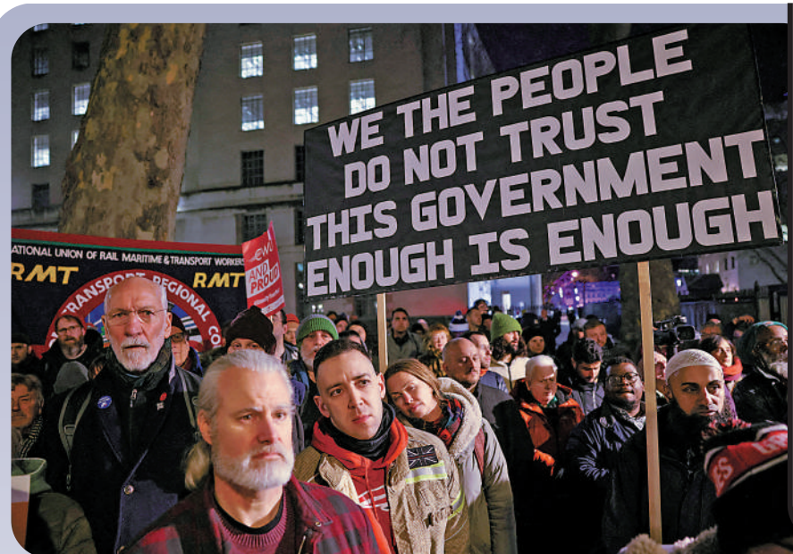
▲英國經濟不景氣，多個行業罷工，政府近期推出的反罷工法引發更多示威。

【大公報訊】綜合《每日電訊報》、《金融時報》、《每日郵報》報道：一份1月29日發布的獨立調查報告指，英國廣播公司（BBC）關於稅收、公共開支、政府債務等重要經濟議題的報道有失偏頗，很可能會誤導公眾。報告指出，很多BBC記者缺乏基礎的經濟學知識，有時還會故意誇大其詞進行炒作。國際貨幣基金組織（IMF）預測，今年全球經濟將會好轉，但英國恐成為唯一一個陷入衰退的主要經濟體，不知BBC又會如何解讀。