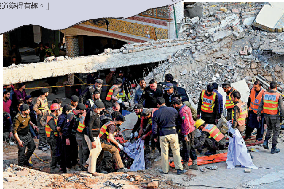
▲白沙瓦市救援人員將清真寺恐襲遇難者遺體從廢墟中運出。

法國退休金改革的最大爭議在於將退休年齡從62歲推遲至64歲。參加示威的巴士司機塔克西埃說：「我們不會一直工作到64歲！對於總統（馬克龍）而言，這可能很容易，畢竟他坐在椅子上，甚至可以一直幹到70歲。」各大工會警告將組織更多罷工活動。但路透社稱，法國工人面臨高通脹和收入減少的威脅，1月31日參加罷工的人數比1月19日少。民調顯示，大部分法國人反對退休金改革，但馬克龍不願讓步。他於1月30日稱，這項改革對於保障退休金制度的可行性至關重要。法國總理博內爾稱，推遲退休年齡「沒有商量餘地」。