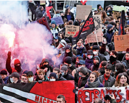
▲1月31日，大批示威者在法國西部城市南特抗議改革退休金制度。

法國於1月19日爆發第一輪反退休金改革罷工和示威，當天逾110萬人參與。各大工會1月31日稱，第二輪示威的規模更大。受罷工影響，法國TGV高速列車僅有三分之一在運行；巴黎地鐵班次銳減；一半的小學教師罷工，部分中學生也參加了抗議活動；法國電力公司（EDF）的數據顯示，法國電力供應下降了4.5%。