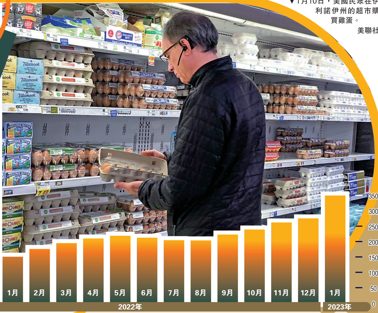
▼1月10日，美國民眾在伊利諾伊州的超市購買雞蛋。

隨着禽流感的蔓延，雞蛋短缺問題在許多國家繼續惡化。日本大型雞蛋販售公司「JA全農雞蛋」表示，具有雞蛋批發價格參考價值的東京地區M號雞蛋，目前的每公斤價格已經升至305日圓（約18港元），比一年前翻了一倍，成為1993年開始統計以來的最高價格。