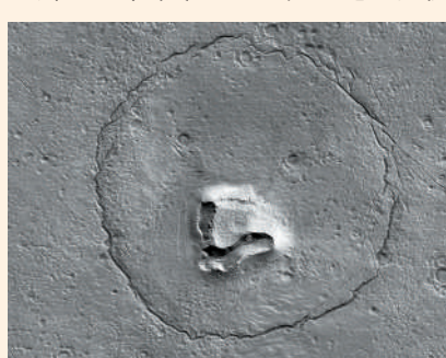
▲NASA公布一張酷似「熊臉」的火星表面照片。

據悉，NASA在2005年發射火星勘測軌道飛行器，以拍攝照片的方式增進對火星地形的了解，為未來航天器著陸的地點提供幫助。