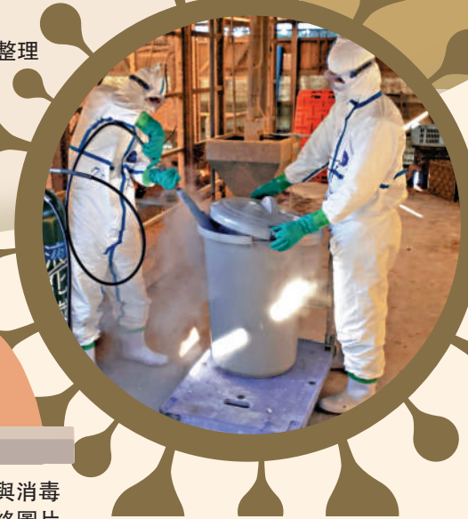
▶今年1月，日本一家養雞場的工作人員進行撲殺清場與消毒工作。