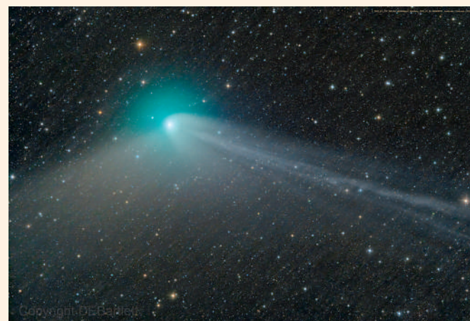
▲彗星C/2022 E3 (ZTF) 將於2月1日最接近地球，可用肉眼觀測。

相比上一顆於2020年7月飛經地球且肉眼可見的「新智彗星」，這顆彗星體積小得多，距離地球會更近。