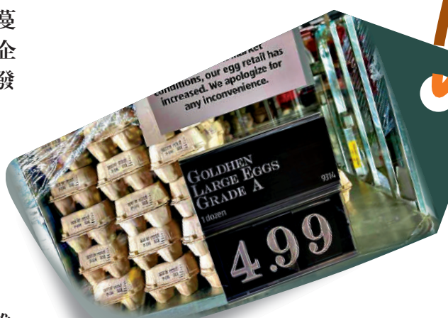
▲美國雞蛋價格飆升。

【大公報訊】綜合《紐約時報》、《衛報》報道：隨着禽流感疫情的蔓延，多國雞蛋供應陷入短缺、價格高企的窘境。日本去年10月踏入禽流感爆發季節，料持續到今年5月。除了雞蛋供應不足，連同雞蛋製造的商品也被迫停止售賣。美國亦推出「雞蛋限購令」，每人每次最多只能購買24枚雞蛋。有美國民眾因為無法承受昂貴的蛋價而從墨西哥走私雞蛋。此外，新西蘭因為「禁止籠養雞隻」法令的實施同樣面臨「雞蛋荒」。