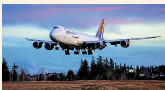
▲1月10日，波音交付的最後一架747飛機完成試飛工作。

波音迄今共製造1574架747飛機，波音於2020年7月宣布將停產所有747系列飛機。隨着飛機科技發展和疫情的衝擊，747機型已逐漸被更省油的波音777，還有法國空中巴士A350等機型取代。