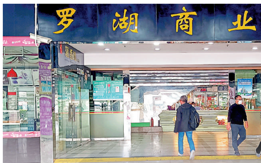
▲1月31日，羅湖商業城不時有商戶進出，為店舖重開做準備。▶羅湖商業城商戶一經復業，便吸引了本地客光顧。