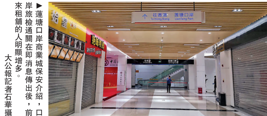
▶連塘口岸商業城保安介紹，口岸旅檢通關在即消息傳出後，前來租舖的人明顯增多。

羅湖口岸附近許多的的士司機也期盼早日通關，這樣大量香港和外國遊客將帶來許多業務，未來羅湖口岸也是其每天重要的拉客來源地。目前的收入不多，加上支出多，因此，賺不了什麼錢，通關後會有大量的港人和外國遊客的打的需求，從而有利提高收入。