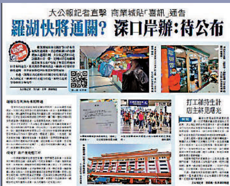
▲《大公報》1月20日刊出的「新聞追蹤」，率先報道羅湖口岸將於春節後通關的消息。記者直擊採訪羅湖商業城，從多家商戶張貼的物管通告發現有關內容。

在口岸外圍，周邊的社康、藥房、商舖、銀行均在營業，社康開診時間從早上8點持續到晚上9點，但蓮塘口岸商業城內的商舖幾乎全部處於休業狀態，只有中國銀行一家正常營業。據保安介紹，疫情以來，這些商舖都處於關門狀態。「聽聞2月中旬蓮塘口岸旅檢通關，最近來租舖的人也增多了，今天租了3個舖面。」