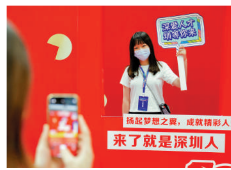
▲在深圳高校畢業生就業雙選會上，工作人員舉着「深愛人才圳等來」招牌歡迎應聘者。

這是深圳2020年以來第三次開展服務「雙區」建設專項招錄公務員，過去兩年已招錄了1884名公務員。