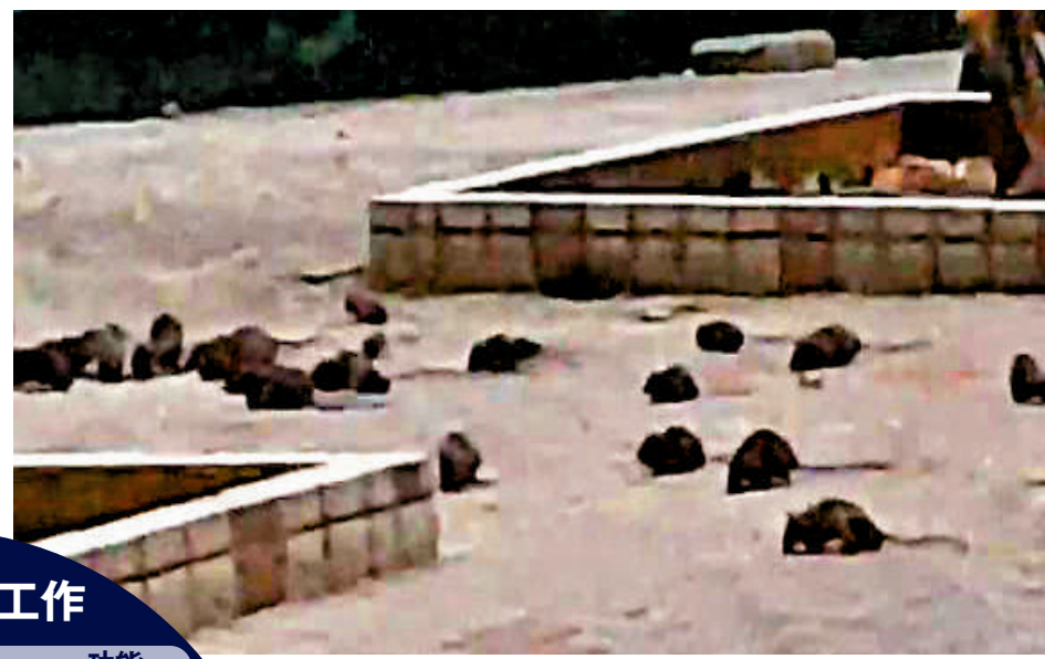
▲屯門蝴蝶邨一帶去年10月老鼠肆虐，網上片段顯示群鼠四處遊走，房署即採取行動大舉滅鼠。