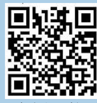
打擊衛生黑點網頁

政府打擊衛生黑點計劃： www.hygieneblackspots.gov.hk