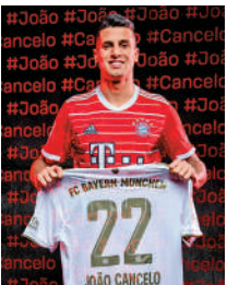
▲拜仁慕尼黑後衛祖奧簡斯路