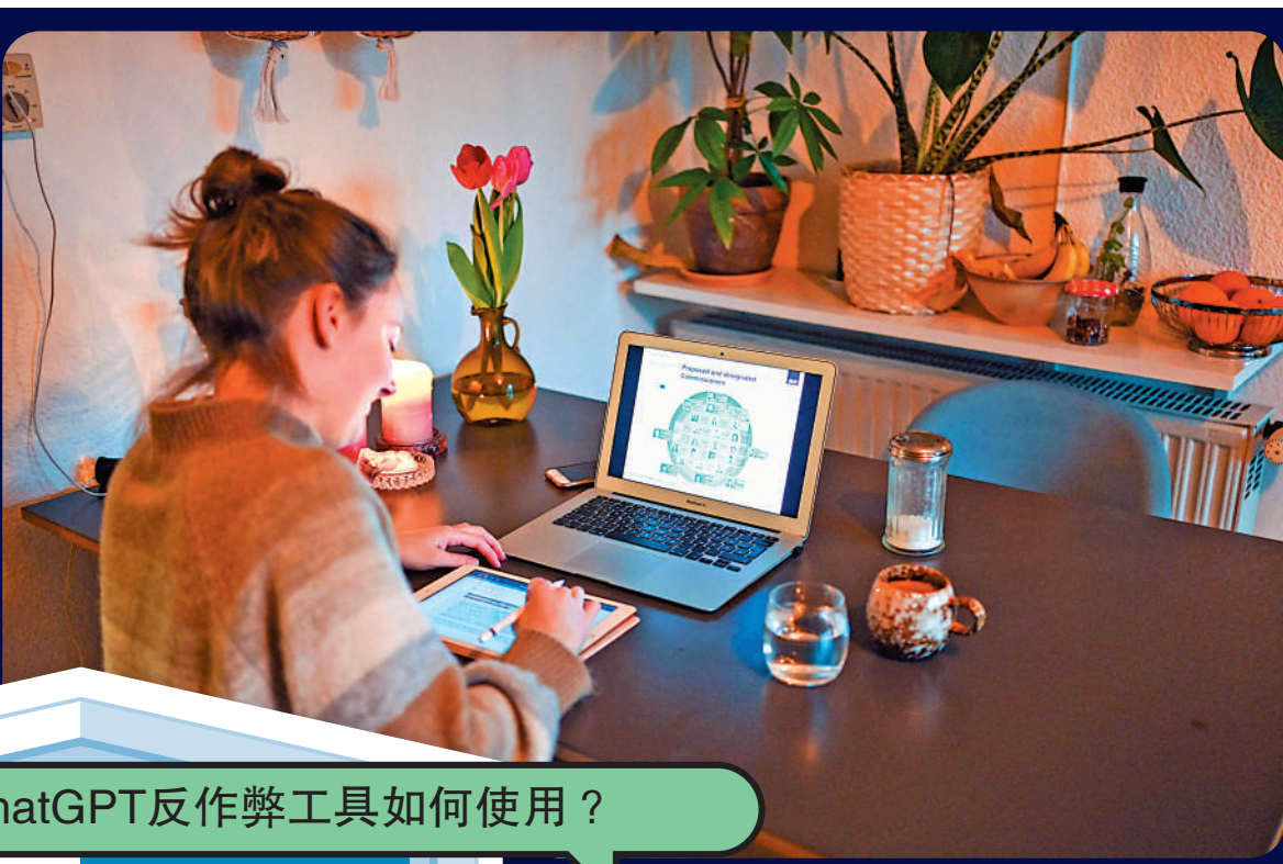
▲部分學校為防止學生作弊，宣布禁止使用ChatGPT。