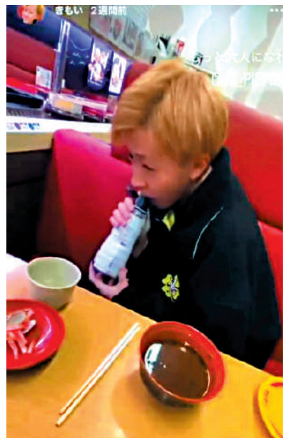
▲日本一名高中生在壽司郎迴轉壽司店舔醬油瓶惡搞，引起軒然大波。網絡圖片

影片顯示，一名染金髮的年輕男子趁店員離開時先拿起醬油瓶舔瓶口，再從茶杯放置處拿起茶杯舔，隨後將茶杯放回原位，最後還把口水抹在轉盤上的壽司上。隨後，該名高中生被指是日本岐阜縣立岐南工業高中2年級的學生。