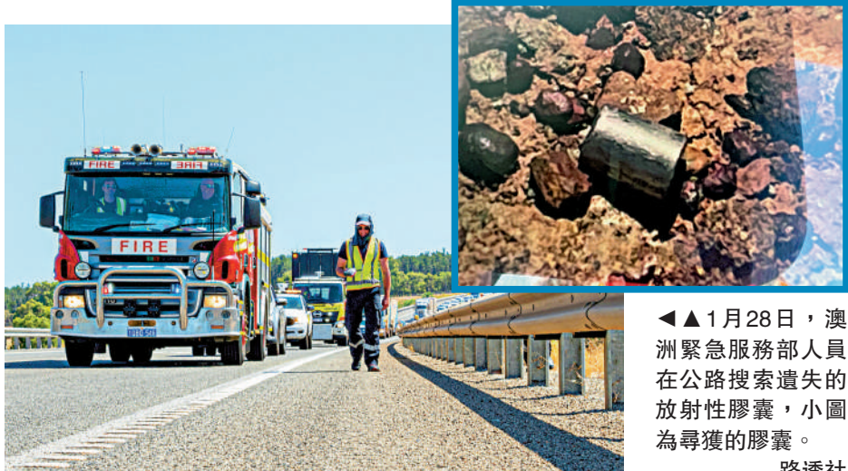
▲▲1月28日，澳洲緊急服務部人員在公路搜索遺失的放射性膠囊，小圖為尋獲的膠囊。

不過，運輸外包出去的力拓並未在第一時間通報丟失意外，而是隔了一周才知會相關部門。而在尋獲膠囊後，當局對力拓僅處以「檢討不當處理放射性物質」的1000澳元（約5600港元），每多一天就多50澳元（約280港元）的罰款。澳洲總理艾班尼斯亦表示，罰款數字「低得荒唐」。