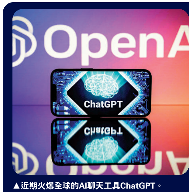
▲近期火爆全球的AI聊天工具ChatGPT。

雖然ChatGPT的出現掀起了有關作弊的爭議，但它的出現或會加速AI時代的發展速度。據悉，為了應對ChatGPT的出現，Google內部傳出正在測試一款聊天機器人「Apprentice Bard」，被認為是ChatGPT的未來競爭對手。