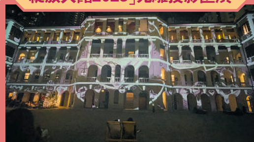
▲ 「綻放大館」光雕投影匯演璀璨奪目。

日期：即日起至2月12日（2月6日除外） 時間：晚上6時30分至9時15分 地點：中環荷里活道10號大館檢閱廣場 備註：匯演每節15分鐘，隔半小時上演1次，每晚6次