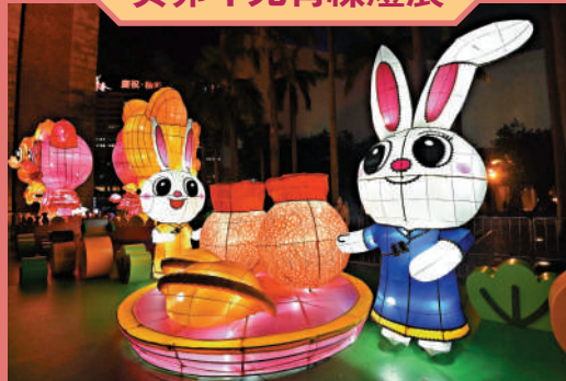
▲ 香港文化中心現正舉行元宵綵燈展，圖為以兔子為造型的綵燈。

日期：即日起至2月7日 時間：晚上6時至11時 地點：香港文化中心露天廣場、北區公園、荃灣公園