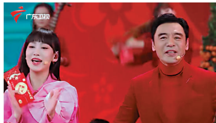
▲ 鍾鎮濤（右）與炎明熹參與「廣東衛視春節晚會2023」。

在剛過去的春節，鍾鎮濤作了新嘗試，為廣東衛視春晚擔任主持。他坦言主持不是自己的專長，要下很大決心才做到，但既然有此機會，何不試試呢？又笑說：「到開會時才知驚，最難的是要雙語表達，唱廣東歌突然轉唱普通話版都可能反應不來，更何況講稿。有些內容又不能直譯，個腦要轉得好快，這個問題都對我造成困擾。」