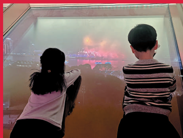
▲孩子們在江景房窗戶欣賞煙花。