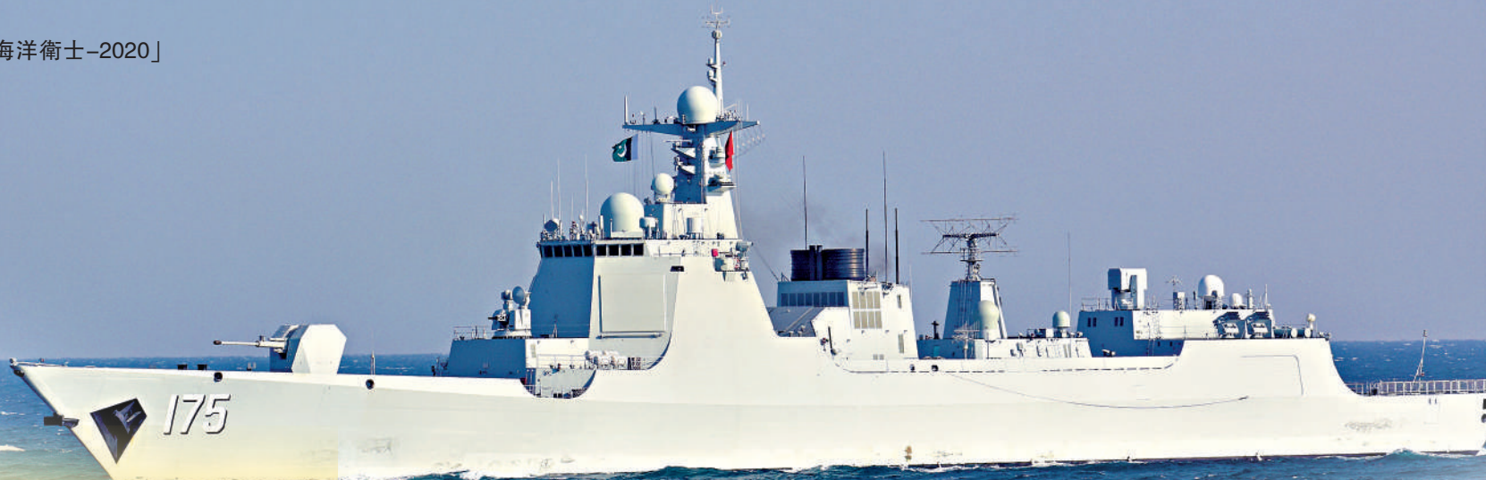
►圖為銀川艦參與「海洋衛士-2020」中巴海上聯合演習。

歲末年初，海軍052D型導彈驅逐艦銀川艦單騎航行萬餘里，遠赴東南太平洋海域，相繼突破三道島鏈，直抵南太平洋島嶼一帶，刷新了中國海軍單艦執行任務航程紀錄，展現了「中華神盾」強大的遠洋行動能力，為海軍遂行陌生海域多元任務作了重要探索，有助於艦艇編隊未來遠洋行動，獲官方媒體譽為「萬里走單騎，利劍向深藍」。