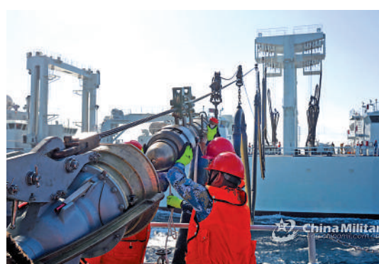
▲銀川艦曾多次在遠航任務中接受海上補給。

海軍官微顯示，銀川艦還開展了防空導彈、反艦導彈發射訓練。這艘王牌驅逐艦萬里馳騁，除了錘煉檢驗遠航性能、磨礪裝備火力外，也藉此熟悉不同海域的航線、水文、氣象環境。這種探索，有助於艦艇編隊未來遠洋行動，以及反封堵、反介入作戰。