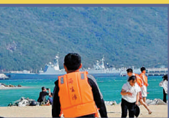
▲今年1月28日，有民眾在海南目擊銀川艦已靠泊碼頭。

銀川艦 艦型：052D型導彈驅逐艦 舷號：175 滿載排水量：約7000噸 最高速度：32節 主要武器：64單元通用垂直發射系統 艦載機：一架直-9C 部分資料為外界推測