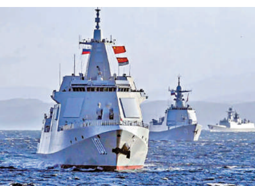
▲南昌艦2021年除航近美國領土外，還參與了中俄首次海上聯合巡航。

按照三條島鏈的劃分，第三島鏈以夏威夷群島為中樞，北起阿拉斯加和阿留申群島，向南則延伸至美屬薩摩亞等南太平洋島嶼，以及澳洲、新西蘭等美國盟友。此次銀川艦在東南太平洋海域的航跡，橫穿第三島鏈南端。中國軍艦在第三島鏈不同區域的存在更多元化。