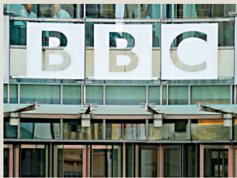
▲BBC多次涉華報道被批帶有偏見，有違職業操守。

另外，今年1月，英國數碼、文化、媒體及體育大臣唐萃蘭亦批評BBC存在偏見。而在1月29日發布的獨立調查報告指，BBC關於稅收、公共開支、政府債務等重要經濟議題的報道有失偏頗，很可能會誤導公眾。報告指出，很多BBC記者缺乏基礎的經濟學知識，有時還會故意誇大其詞進行炒作。