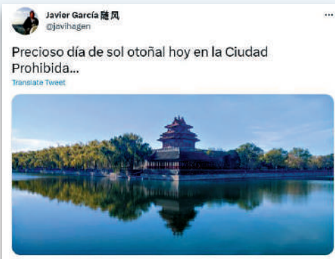
►哈維爾·加西亞經常在推特平台分享有關中國人文風景的帖子。網絡圖片

【大公報訊】據新華社報道：西班牙資深記者哈維爾·加西亞在他的新書《中國：威脅還是希望》中起底西方媒體抹黑中國的