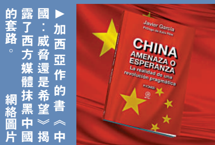
►加西亞作的書《中國：威脅還是希望》揭露了西方媒體抹黑中國的套路。