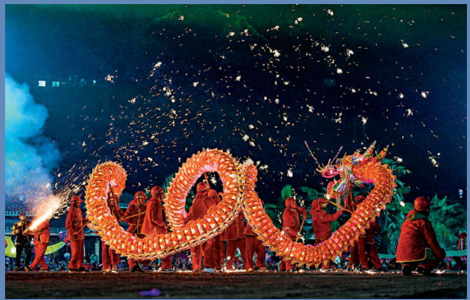
◀中國傳統節日萬家燈火，擊碎外間所謂「黑暗時刻」的不實報道，圖為貴州省4日舉辦苗族「舞龍」活動。新華社

加西亞赤裸地揭露了西方媒體的「套路」：中國富裕的企業家不是「企業家」而是「寡頭」；中國腐敗官員不是「被解職」而是「被清洗」；