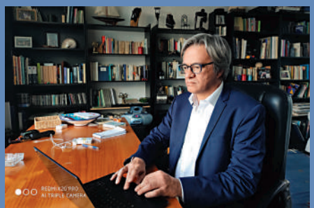
◀西班牙資深記者哈維爾·加西亞於2018年來中國工作。