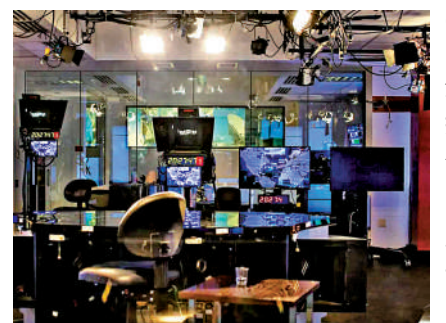
◀美國之聲被指模糊新聞報道和宣傳的界限，圖為該媒體一處演播廳。

並投資發展繞開審查的科技，以及監督和評估相關項目。文件中並詳細列明，這每年1億美元將用於何處，其中不少於7000萬美元須用於自由亞洲電台；不少於550萬美元須用於電子媒體，以對抗中國之外的非中文宣傳，以及中國國內的中文宣傳等。而在該法案2021年的版本，就更直白地寫明，部分經費將用於資助「獨立媒體」和所謂的「第三方」民間團體，用於反華報道，散播關於中國「一帶一路」的「負面消息」，該方案曝光後引起眾多反對和質疑聲音，最終被刪改。