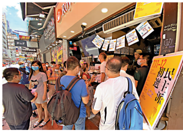
▲亂港分子於2020年進行非法「初選」。

其餘42名被告則參選，公開承諾會追求上述目標和受初選結果約束，參選人需承諾由得票率最高者參選正式選舉，部分人擔當「Plan B」以