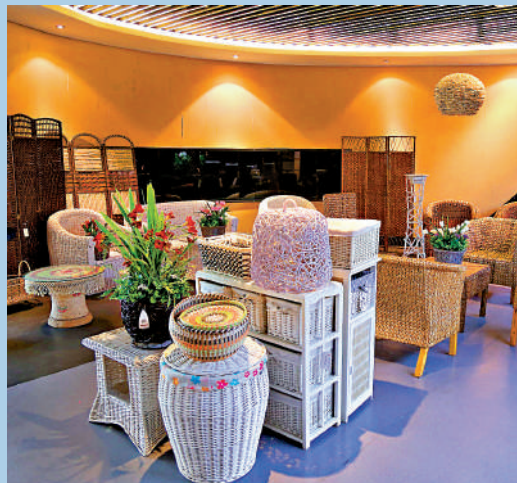
▲臨沂出產的柳編傢具。