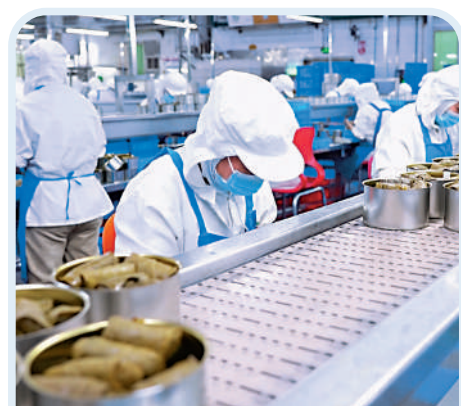
▲出口歐盟的「朵爾瑪」生產車間。

●曹縣棺材和日本喪葬業的合作始於2000年，因其價廉質優佔據日本超過9成棺材市場，目前已與漢服一同成為該縣兩大特色產業。