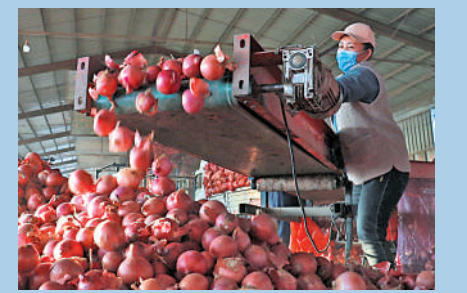
▲巨野縣洋蔥年出口2萬噸。

400多人。種植面積佔全省近五分之一的巨野縣洋蔥也經歷了類似的出口過程。當地一家生鮮果蔬菜貿易企業負責人在一次偶然機會中接觸到國外客商，有了試水洋蔥出口的想法。他先後到非洲、馬來西亞、泰國等國家考察當地市場，卻發現不同國家有不同的洋蔥收購標準。公司通過精準分類供給策略讓巨野洋蔥在海外市場得到認可，訂單不斷增加。目前，巨野縣洋蔥年外貿出口2萬噸，交易額5千萬元，成為撬動經濟發展的大產業。