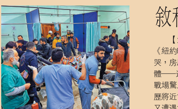
▲6日，敘利亞伊德利卜省北部農村的一家醫院裏擠滿了傷者。