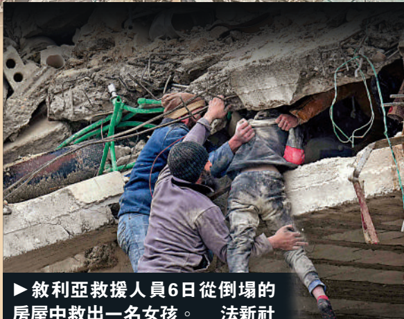
▲敘利亞救援人員6日從倒塌的房屋中救出一名女孩。