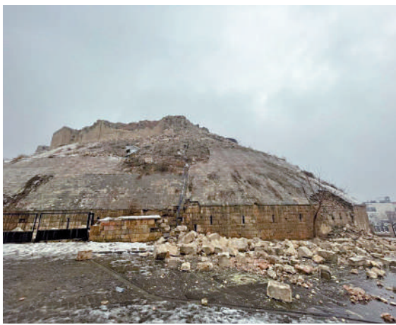
▲有着數千年歷史的「世界文化遺產」加濟安泰普古堡倒塌。

加濟安泰普古堡最初建造年代已不可考究，但據可靠資料顯示，應該是由西帝國首先打造，後來在公元2至4世紀由羅馬帝國改建為瞭望塔，並隨着時間推移而擴建，直至公元527至565年，也就是東羅馬帝國皇帝查士丁尼一世在位期間，開始出現當代古堡形態的雛形。該古堡由12座塔樓組成，周長為1200米。