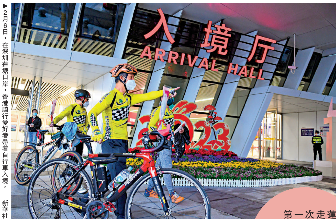
2月6日，在深圳蓮塘口岸，香港騎行愛好者帶着自行車入境。