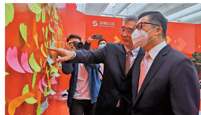
在蓮塘/香園圍口岸旅檢啟用儀式上，香港保安局局長鄧炳強參觀許願牆。

深圳市口岸辦主任王剛表示，全面恢復通關將更大程度促進深港融合相通，為兩地人員交流和經貿往來提供更加方便、快捷、舒適的服務。深圳海關行郵監管處行李物品監管科科长李義章介紹，蓮塘口岸是深圳首個採用「一站式」車輛通關模式的口岸，配備了全國首台CT式H986監管設備，可精準實施非侵入式查驗。當天，經蓮塘口岸出入境人員普遍認為，口岸通關環境舒適、配套設施完善，口岸工作人員的熱情讓他們印象深刻。在鹽田港上班的潘女士家住香港粉嶺，因孩子在香港讀書，疫情之前一直兩地跑，以前多走文錦渡口岸。第一次走蓮塘口岸讓她感嘆「便利」。「從粉嶺到深圳，加上過關總共40分鐘，比我預想的快。」