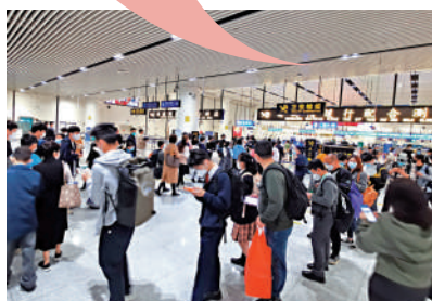
大批學生和家長經蓮塘口岸過關回港。

「今天特意從蓮塘口岸返港，比想像中還要好。」因疫情失業3年的港人黃先生表示，過關非常方便快捷，但美中不足的是坐巴士在上水落車後需行十多分鐘才能抵達火車站。