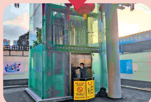
▲旅客必須經過人行天橋才能換乘交通工具，但天橋一側電梯停用。