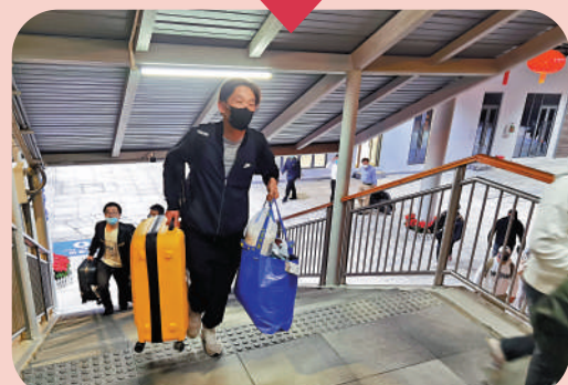
▲旅客只能步行上人行天橋，樓梯沒有斜坡，搬行李不方便。