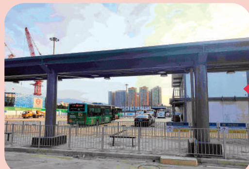
▲皇崗口岸公交場站已經啟用，但車輛較少。