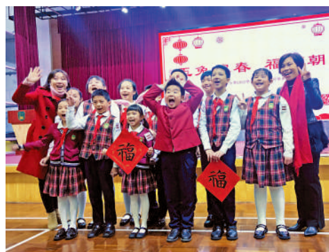
▲開學禮上，港澳班學生與老師合照。

6日上午，廣州朝天小學舉行了別開生面的開學禮，港澳子弟班學生與廣州學生攜手呈現了一場精彩的開學演出。朝天小學校長孔虹表示，隨着內地和香港恢復全面通關，今年將會有更多機會，和香港多所姊妹學校進行深入交流。