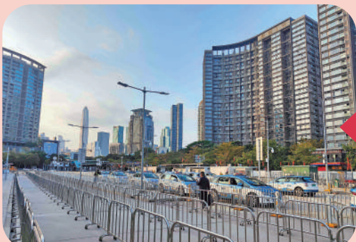
▲的士上客區標識不明顯，周圍被鐵欄杆圍擋，拿行李要繞行。