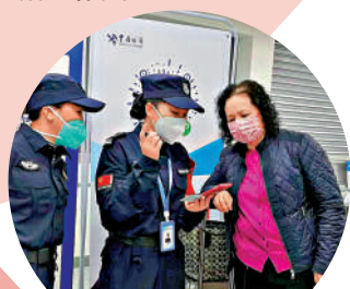
◀老年旅客求助工作人員填寫健康申報。