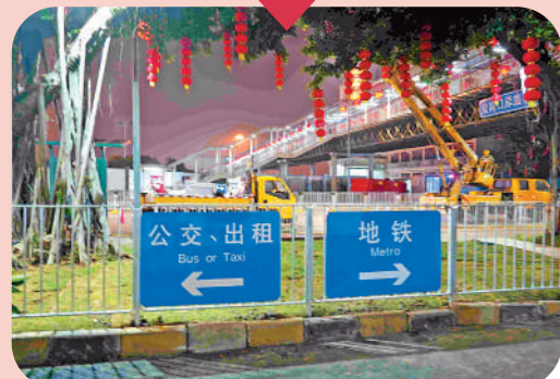
▲穿過天橋後會看到地鐵和的士、公交的交通指示標識。