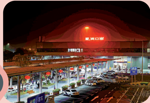
▲旅客從香港抵達皇崗口岸。