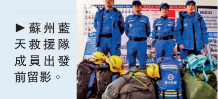
▶蘇州藍天救援隊成員出發前留影。