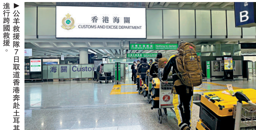
▶公羊救援隊7日取道香港飛赴土耳其進行跨國救援。

2月6日，土耳其東南部鄰近敘利亞地區連續發生兩次7.8級地震，在兩國造成重大人員傷亡和財產損失。中國外交部發言人毛寧7日說，中方十分關注土耳其和敘利亞發生強烈地震。面對當前重大地震災害，中方將全力施以援手。而官方以外，中國社會救援力量亦紛紛行動，其中首支社會力量救援隊已於7日晚自港星夜飛往地震受損最嚴重的災區，在隊伍的微信群裏，「平安歸來」的祝福早已刷屏。