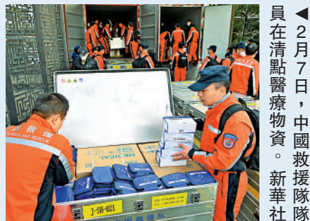
◀2月7日，中國救援隊隊員在清點醫療物資。