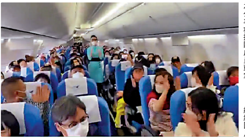
◀由杭州飛往香港的過程中，機上乘客為公羊救援隊成員鼓掌。