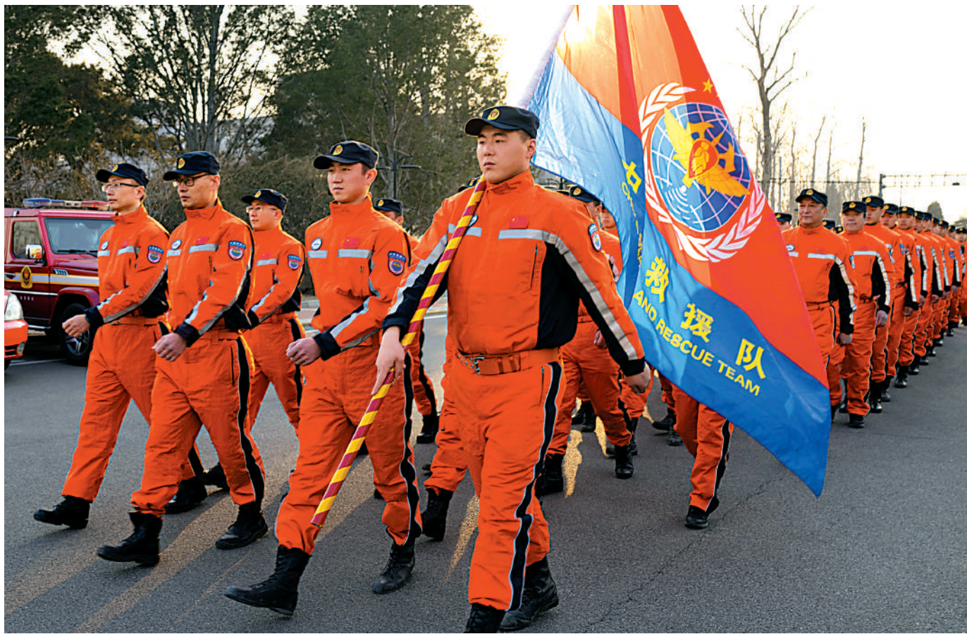
▶2月7日，中國救援隊在首都機場列隊行進，準備乘包機出發飛赴災區。