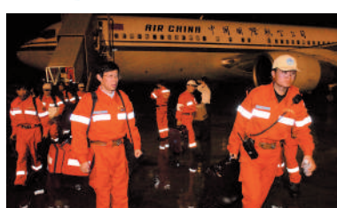
▲2004年12月31日凌晨5點，中國救援隊隊員星夜趕抵印尼。