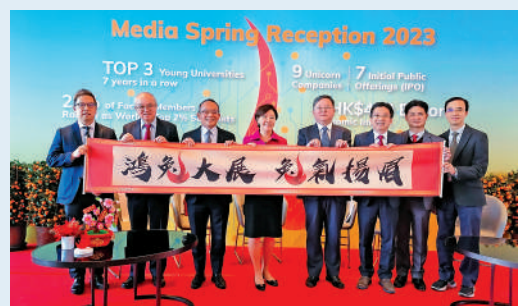
▲香港科技大學領導團隊介紹今年發展大計。

以學科為主的學校模式，而早前九月已經開課的科大廣州均以跨學科學習為主，因此學科模式是不重疊而可互補。她表示，在通關後會開設跨校園學習計劃，增加本地科大及科大廣州的師生交流及合作。