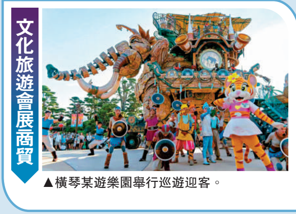
▲橫琴某遊樂園舉行巡遊迎客。