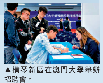
▲橫琴新區在澳門大學舉辦招聘會。

橫琴建立「容錯免責」機制。在橫琴進行的改革創新未能實現預期目標，但是符合橫琴戰略定位和任務要求，決策程序符合法律、法規或者有關規定，未牟取私利或者未惡意申通損害公共利益的，對有關單位和個人免於追究相關責任。