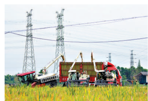
▲成都市村民駕駛農機收割水稻。

制定「天府良田」建設攻堅提質十年行動方案，確保逐步將6308萬畝永久基本農田全部建成高標準農田。