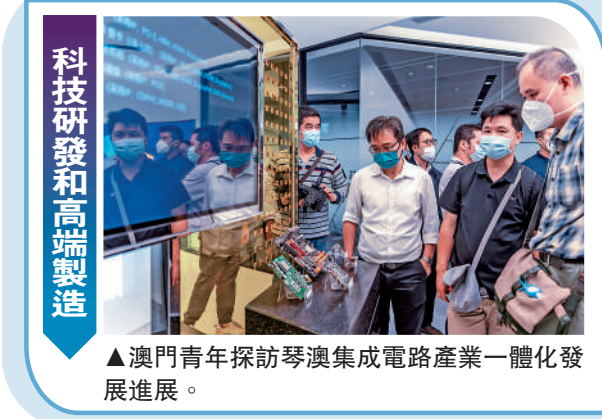
▲澳門青年探訪琴澳集成電路產業一體化發展進展。