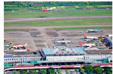
▲珠海將與香港機場合作推出「經珠港飛」服務。圖為珠海機場。

政府工作報告提出，接下來，珠海將進一步拓展港珠澳大橋與珠海機場、高欄港、廣珠鐵路、珠海西部地區以及珠江口西岸發展聯動空間。如加強與香港機場合作，推出「經珠港飛」服務，探索推進港珠澳航空打板合作。據悉，「經珠港飛」客運項目將為旅客提供無縫服務，即通過港珠澳大橋陸路接駁實現「空—陸—空」直通客運服務。若項