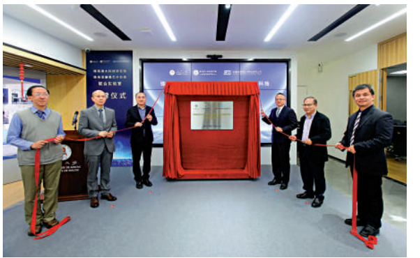
▲8日在橫琴揭牌的「聯合實驗室」聚力AI領域研發。

在《條例》發布的同日，珠海澳大科技研究院—珠海凌煙閣芯片科技有限公司「聯合實驗室」在橫琴揭牌，將研究人工智能生物醫學腦機研發等項目，以5G、大數據中心、人工智能、區塊鏈、雲計算等新型基礎設施作為重要載體，開展全面的生物醫學工程應用與智慧城市應用平台科學技術合作。 據了解，目前橫琴已有多家集成電路設計企業進行14nm以下先進製