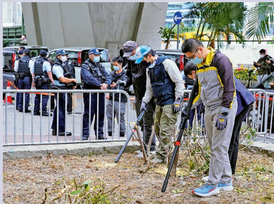
▲警方派員使用金屬探測器在現場一帶搜索。