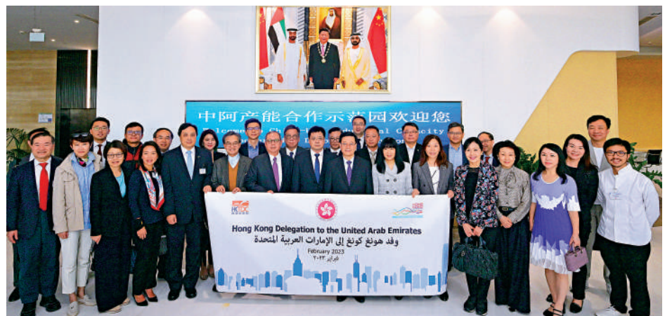
▲李家超與特區代表團參觀產能合作示範園，和中國江蘇國際經濟技術合作集團有限公司董事長宋勤波及示範園代表合照。