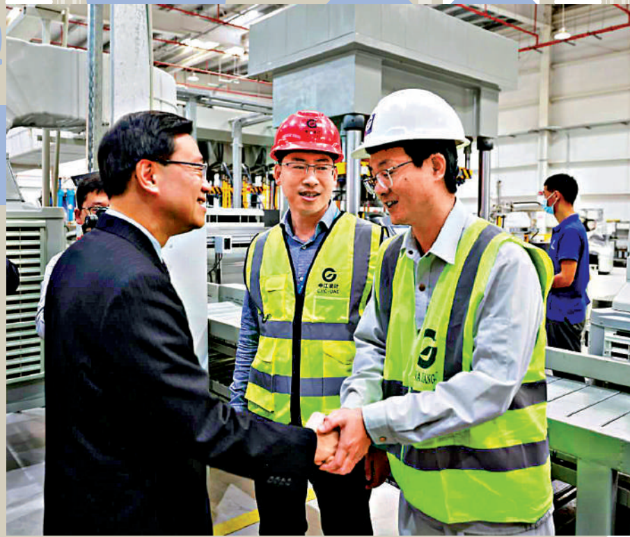
▲李家超表示，示範園是中國與阿聯酋共建「一帶一路」的成功典範。 ▶李家超昨日參觀阿聯酋阿布扎比的中阿產能合作示範園，並與園內中方員工親切交談。