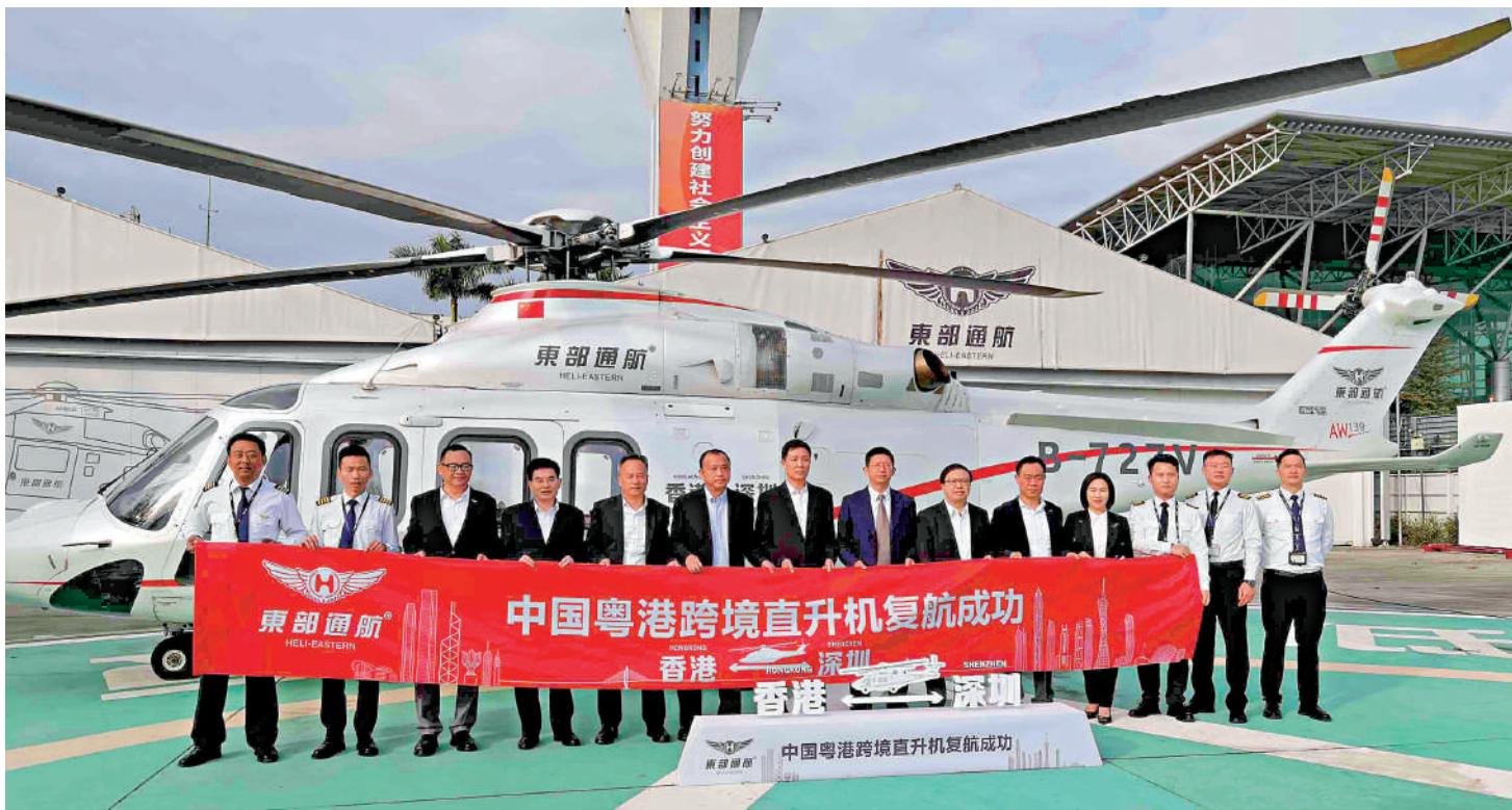
▲2月8日上午，深港直升機跨境飛行復航儀式在東部通航寶安機場應急救援基地舉行。

本輪消費券涵蓋零售、餐飲、生活服務、家電家居、酒店等領域，每位用戶有機會獲得兩張不同領域的消費券，其中，特設520元愛情專享消費券，陪伴深港單身青年在深圳度過甜蜜情人節。此輪消費券將在2月9日當天抽取，獲得優惠券的市民群眾可於2月9日~2月18日期間在合作商戶處消費。