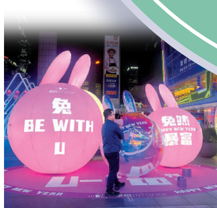
▲羅湖區內商圈以全新面貌吸引港人消費。

跨境低空旅遊 從深圳灣到維多利亞港，飛行高度300米，多維度視角體驗低空旅遊，360°感受深圳和香港的獨特魅力。