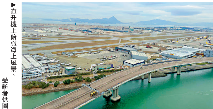
直升機上俯瞰海上風景。