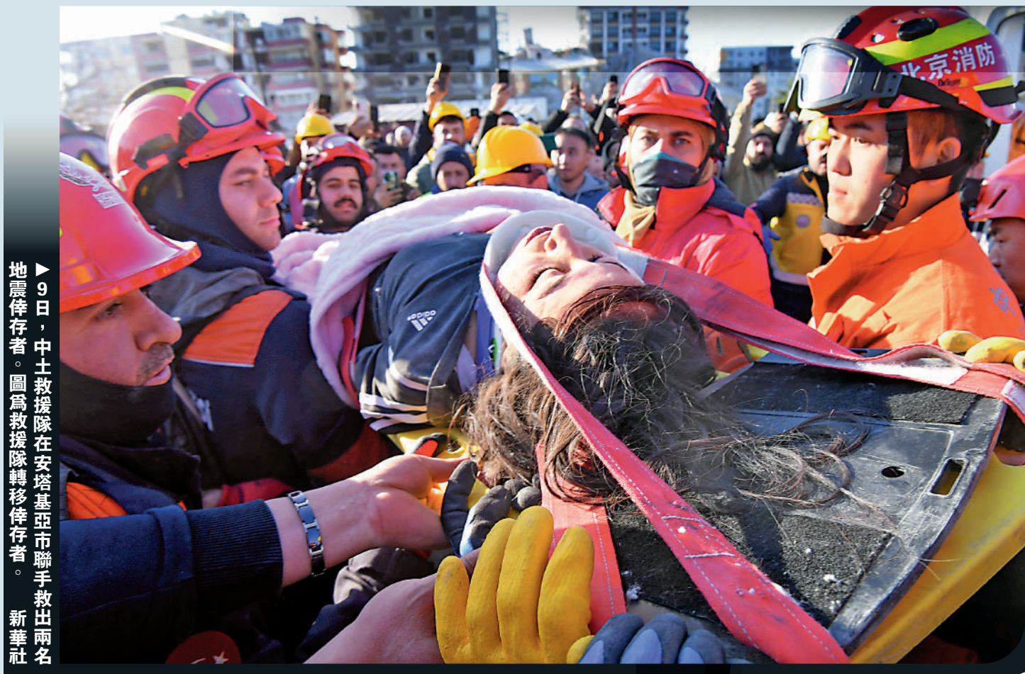
9日，中土救援隊在安塔基亞市聯手救出兩名地震倖存者。圖為救援隊轉移倖存者。