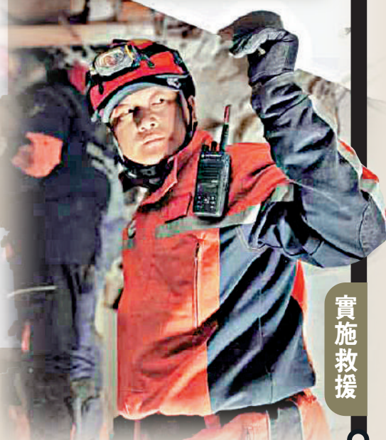
●9日晚，一名中國救援隊隊員在一棟倒塌的7層樓房廢墟中參與救援。新華社