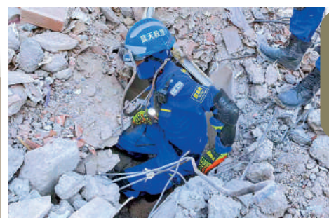
●10日，中國藍天救援隊隊員開展搜救作業時開關通道。