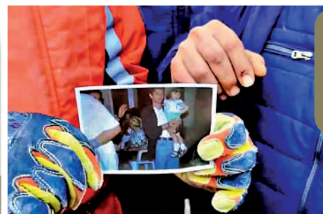
●中國救援隊在廢墟中，找到一戶主人的全家福照片。屋主家人看到後相擁而泣，並對救援隊表示感謝。