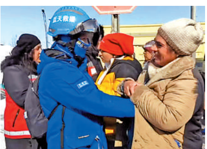
▲土耳其居民將中國救援隊隊員的手放進衣懷取暖。

隊員擁抱，由於當地氣溫較低，不少救援隊隊員裸露在外的手被凍得通紅。「有個居民發現我們的隊員的手非常冷，她有一個特別暖心的舉動就是把我們隊員的手放進她的衣懷裏，讓人感動，這也是現場的群眾對於救援隊最大的支持和鼓勵。」