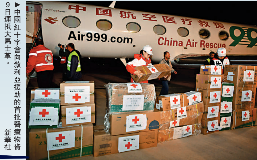
9日運抵大馬士革。新華社

據悉，中方援助的220噸小麥正在運送途中，餘下的3000餘噸大米和小麥將於近期分兩批發運。