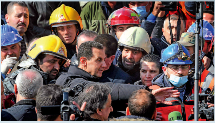
▶敘利亞總統巴沙爾(中間黑衣)10日到阿勒頗災區視察。