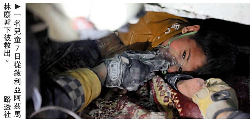
▶一名兒童7日從敘利亞阿拉伯路透社廢墟下被救出。

【大公報訊】綜合CNN、新華社、半島電視台報道：土耳其南部靠近敘利亞邊境地區6日發生7.8級強震，截至9日晚，土敘兩國共計超過2.2萬人遇難，其中敘境內近3400人死亡。與土耳其不同，美國及西方對敘利亞常年實施單邊制裁，大大削弱了敘方救災賑災能力，加上地震破壞道路等基礎設施，救援物資和設備進入受阻。世衛組織表示，當地持續遭遇降雪與低溫等惡劣天氣，燃料、電力、通訊等基本生活設施受損嚴重，敘利亞災民恐面臨「二次災難」。