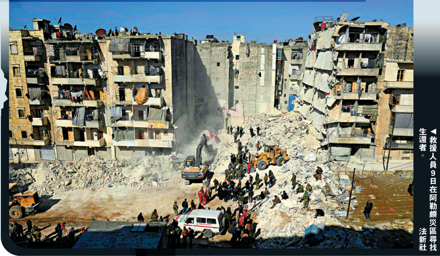
◀救援人員9日在阿勒頗災區尋找生還者。