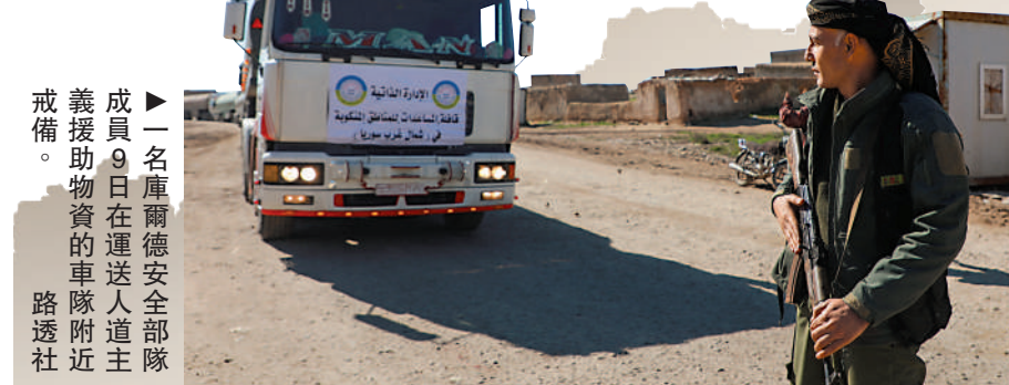
▶一名庫爾德安全部隊成員9日在運送人道主義援助物資的車隊附近戒備。

敘利亞常駐聯合國代表薩巴格指出，很多貨運飛機因為美國和歐盟的制裁而拒絕在敘利亞境內機場降落。所以，即便是那些想要提供人道援助的國家，他們也無法使用貨運飛機，「而這就是因為制裁」。直到9日，才有第一支聯合國援助車隊從土