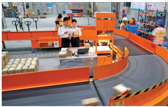
▲南沙海關關員在南沙保稅港區跨境電商倉庫巡倉監管。

嶺南春來早，灣區開新局。作為粵港澳全面合作示範區、國家級新區、自貿試驗區，廣州南沙近日迎來香港與內地恢復全面通關後首個訪問內地的香港大型考察團。吹響高質量發展衝鋒號，今年也是《廣州南沙深化面向世界的粵港澳全面合作總體方案》全面實施的關鍵年。《大公報》今起推出《南沙·香港機遇》系列專題，從物流樞紐、社區建設和雙創支援三方面，探討剖析南沙攜手香港全面合作共建國際一流灣區帶來的新機遇。