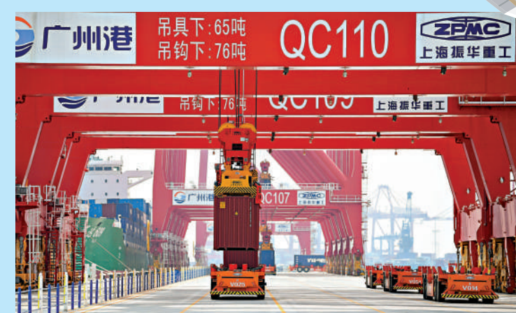
▲在廣州港南沙港區四期全自動化碼頭，北斗導航無人駕駛智能導引車有條不紊地運行。新華社