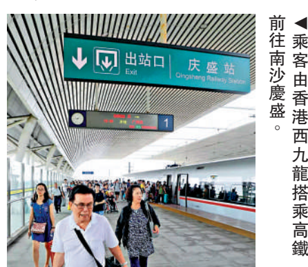
▲乘客由香港西九龍搭乘高鐵路往南沙慶盛。

作為《廣州南沙深化面向世界的粵港澳全面合作總體方案》中的三大先行啟動區之一，南沙慶盛樞紐區塊將重點發展人工智能、智慧交通、科技創新、國際教育、專業服務等產業，打造粵港產業融合發展的新高地。