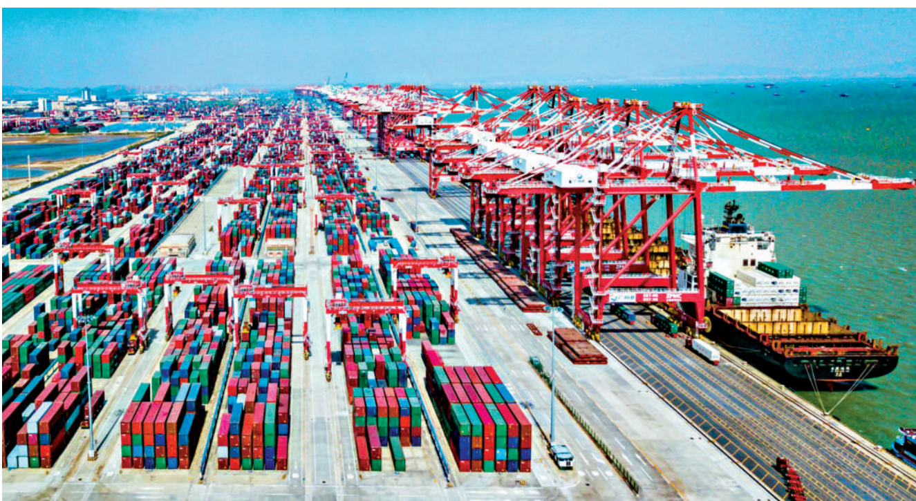
▲廣州港南沙港區外貿班輪航線達150條，通達100多個國家和地區的400多個港口。

關負責人說，「一『進』一『出』」，讓南沙不僅成為珠三角與港澳的「超級聯繫人」，也變為大灣區與世界的接軌者。