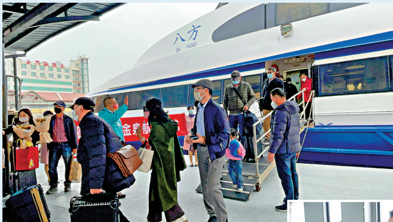
▲時隔三年，福建泉州至金門「小三通」客運航線（即泉金航線）10日恢復通航。圖為金門鄉親乘船到達金門水頭碼頭。

國務院台辦發言人朱鳳蓮2月8日在北京表示，民進黨當局雖同意所謂「小三通」專案常態化實施，但繼續將金、馬地區以外的同胞排除在外，讓「小三通」難以發揮在兩岸交流往來中應有的作用。