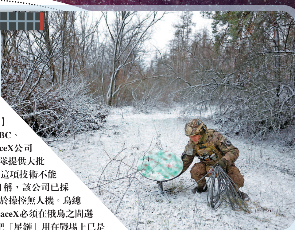
▲烏克蘭士兵1月6日在烏東前線使用「星鏈」。

【大公報訊】綜合《衛報》、BBC、美聯社報道：美國SpaceX公司創始人馬斯克向烏克蘭軍隊提供大批「星鏈」終端，但近日強調這項技術不能被武器化。SpaceX公司高層8日稱，該公司已採取措施限制烏軍將「星鏈」技術用於操控無人機。烏總統顧問波多利亞克大為不滿，要求SpaceX必須在俄烏之間選邊站隊。一名烏克蘭軍方官員稱，烏方把「星鏈」用在戰場上已是廣為人知的事實，SpaceX突然說出這番話令人感到奇怪。