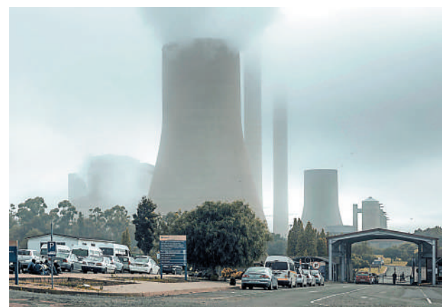
業發放援助，並優先保障醫院、污水處理廠等關鍵基礎設施免於停電。拉馬福

拉馬福薩9日在開普敦市市政廳發表2023年度國情咨文時說，國家災難管理中心將電力危機及其影響確定為一場災難；在國家災難狀態下，南非將向食品生產、存儲和零售供應鏈中的企