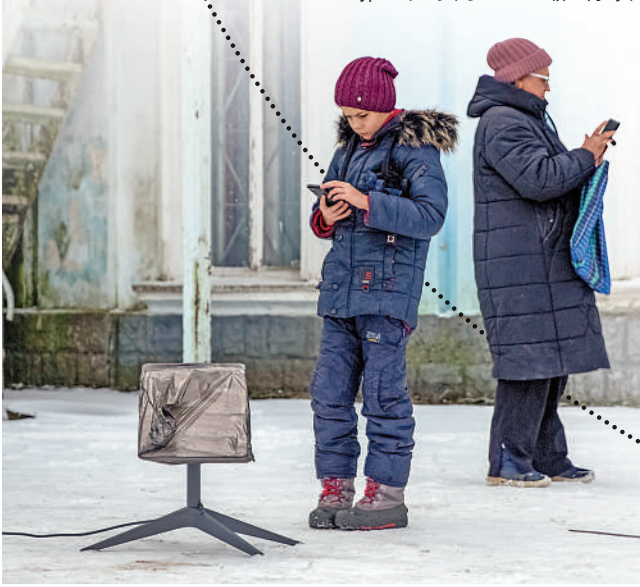
▲烏克蘭平民亦高度依賴「星鏈」提供網絡服務。