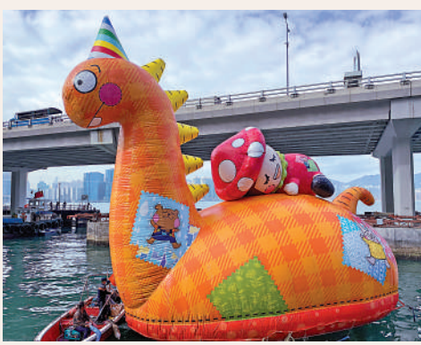
▲12米高的巨型東東與法天娜Fatina，在北角碼頭對開的海面出現，即成為市民「打卡」熱點。