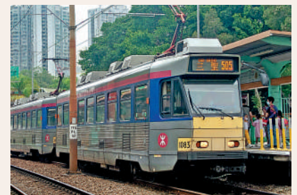
▲日產第二期輕鐵列車即將全面退役，不少鐵路迷都表示不捨。

俗語有云「舊的不去，新的不來」，更換的第五期輕鐵列車，車身為綠、紫、白色，並裝設改良的LED照明系統，並加強空間感，並較第二期輕鐵提供更多座位，另外亦提供最佳的扶手和吊環配置。