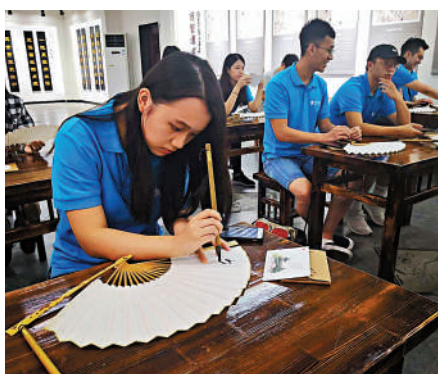
▲教聯會擔心，假如考察時間過短，學生未必對內地有所體會。資料圖片

對於中五生是否獲豁免參與內地考察團，他指如因疫情而無法返回內地，可以接受；但現時已經全面通關，加上內地考察屬於重要學習的一部分，學校應該支持。