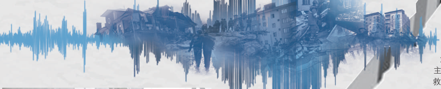
▲日本NHK電視台拍攝製作的48分鐘紀錄片《3/11——海嘯來襲：最初的3天》。