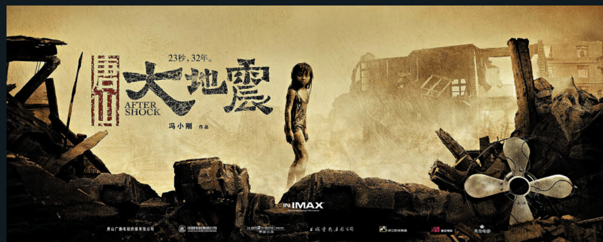
▲電影《唐山大地震》為追求真實的地震場面耗資三千萬人民幣進行特效製作。