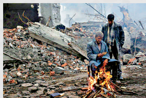
▲《亞美尼亞大地震》讓觀眾直面地震的殘酷。