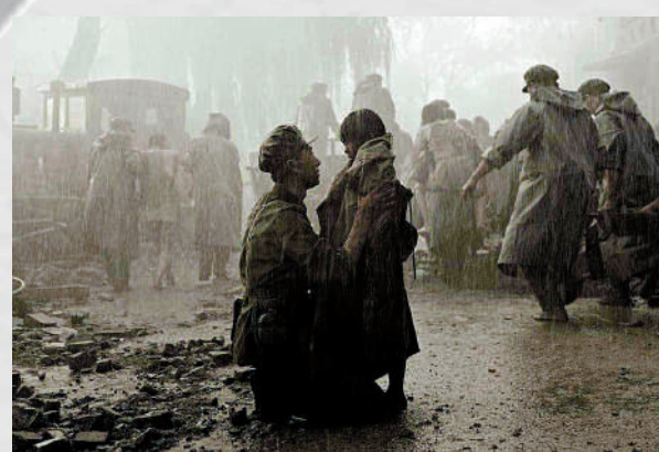
▶電影《唐山大地震》聚焦震後受災民眾心靈重建的歷程。