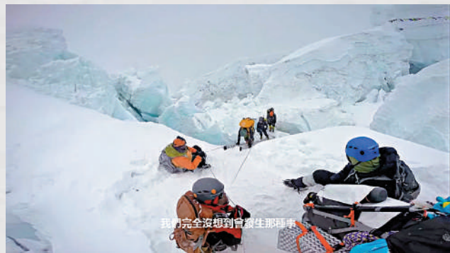
▲紀錄片《劫後餘波：珠峰與尼泊爾大地震》用倖存者拍攝的第一手資料和真實鏡頭記錄了2015年的尼泊爾大地震。

你一定看到過地震之後，被困在廢墟中的倖存者在若干個小時之後，最終被成功救出來的畫面。這是很神奇的一幕，當你看到一群人，幾十個甚至上百個人，在一片廢墟之中，花了幾天時間，成功救出了一個曾經被絕望深深掩埋的生命時，你會感覺到希望在那一刻充盈了自己身體中的每一根神經。雖然理性上，知道還有很多人沒有被救出來，但我們、但人類還是需要這樣「劫後餘生」的故事，因為只有這樣，才有希望。在地震面前，人類的渺小是如此的明顯，如果沒有希望，緊隨渺小而來的，就是彷徨與無助。也因為只有這樣，才能不但擺脫個人的無力感，更能在人與人的連接中，讓群體的力量彼此支持，從而重新燃起與自然災害較量的勇氣。