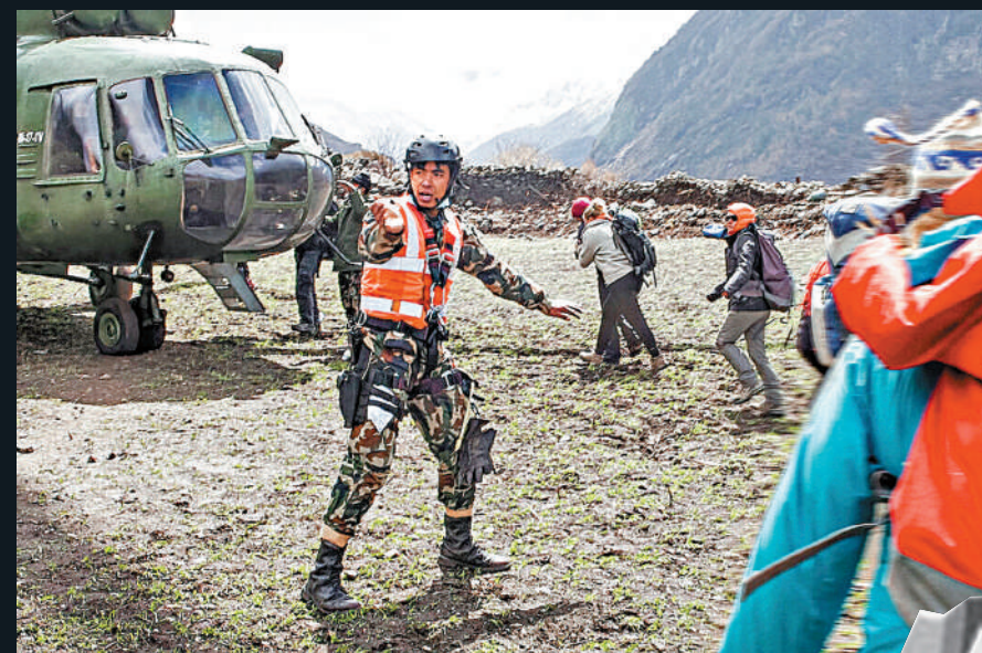
▲Netflix三集系列紀錄片《劫後餘波：珠峰與尼泊爾大地震》。