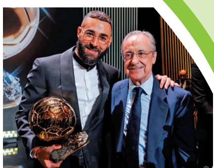
▲賓施馬（左）獲2022年度金球獎獎項。資料圖片

國際足聯年度最佳男子足球員獎近6屆共產生4位得主，包括葡萄牙球星C朗拿度（兩次）、波蘭前鋒羅拔利雲度夫斯基（兩次）、克羅地亞中場莫德里及美斯，近兩屆得主羅拔今屆三甲不入，麥巴比及賓施馬則首次進入三甲。