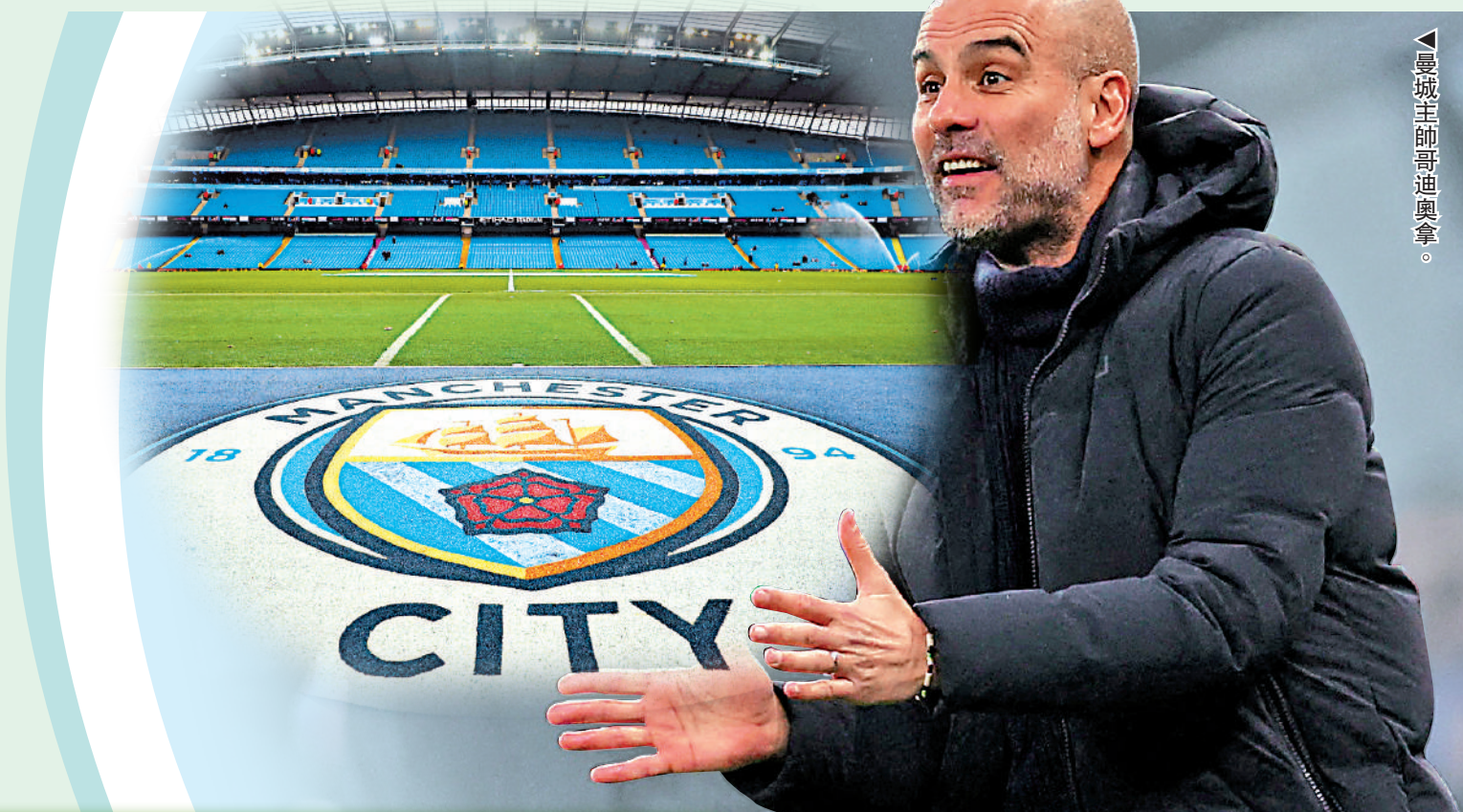
▲曼城主帥哥迪奧拿。

談到曼城如何處理這次指控，哥帥表示曼城已有優秀的律師可以解決今次問題，假如曼城是無辜的，現在輿論帶來的損失誰也不能彌補，但假如曼城真的有罪，他與曼城都會接受法官或者英超聯賽的判決，即使要他們像以前一樣去到低級別聯賽也欣然接受。哥帥亦指目前會繼續專心帶好球隊，並以衛冕英超錦標及奪得歐聯冠軍努力。