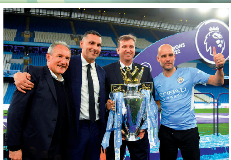
▲曼城奪上屆英超冠軍，哥帥（右）與主席穆巴拉克（左二）合照。資料圖片