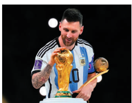
▲美斯奪世盃冠軍，爭2022年度最佳男子足球員機會高。

【大公報訊】據每日郵報報導：國際足聯週六公布2022年度最佳男子足球員（世界足球先生）最後3強候選名單，幫助阿根廷贏得去年卡塔爾世界盃冠軍的阿根廷球星美斯，成為奪獎大熱，他將與法國「孖寶」、美斯在巴黎聖日耳門的隊友基利安麥巴比，及為皇家馬德里贏得西甲及歐聯冠軍的前鋒賓施馬競爭殊榮。