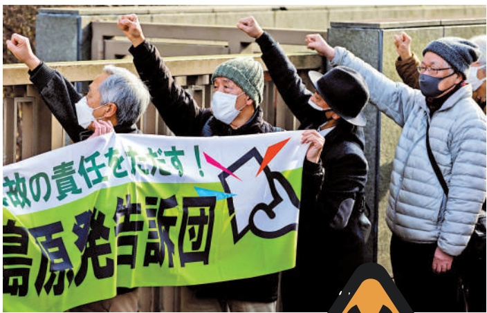
▲1月18日，日本民眾在東京高等法院門口，抗議福島核災事故中東京電力公司高層被判無罪的裁決。

【大公報訊】綜合《衛報》、美聯社報道：日本福島海域捕獲的海魚又被發現輻射物含量超標。福島縣漁業協同組合聯合會7日稱，從福島縣附近海域捕撈的海鱸魚體內檢測出超標的放射性物質鉍，並立即禁止捕撈的海鱸魚上市。香港食物環境衛生署食物安全中心表示會加強日本進口食品的檢測，繼續密切監測和進行風險評估。