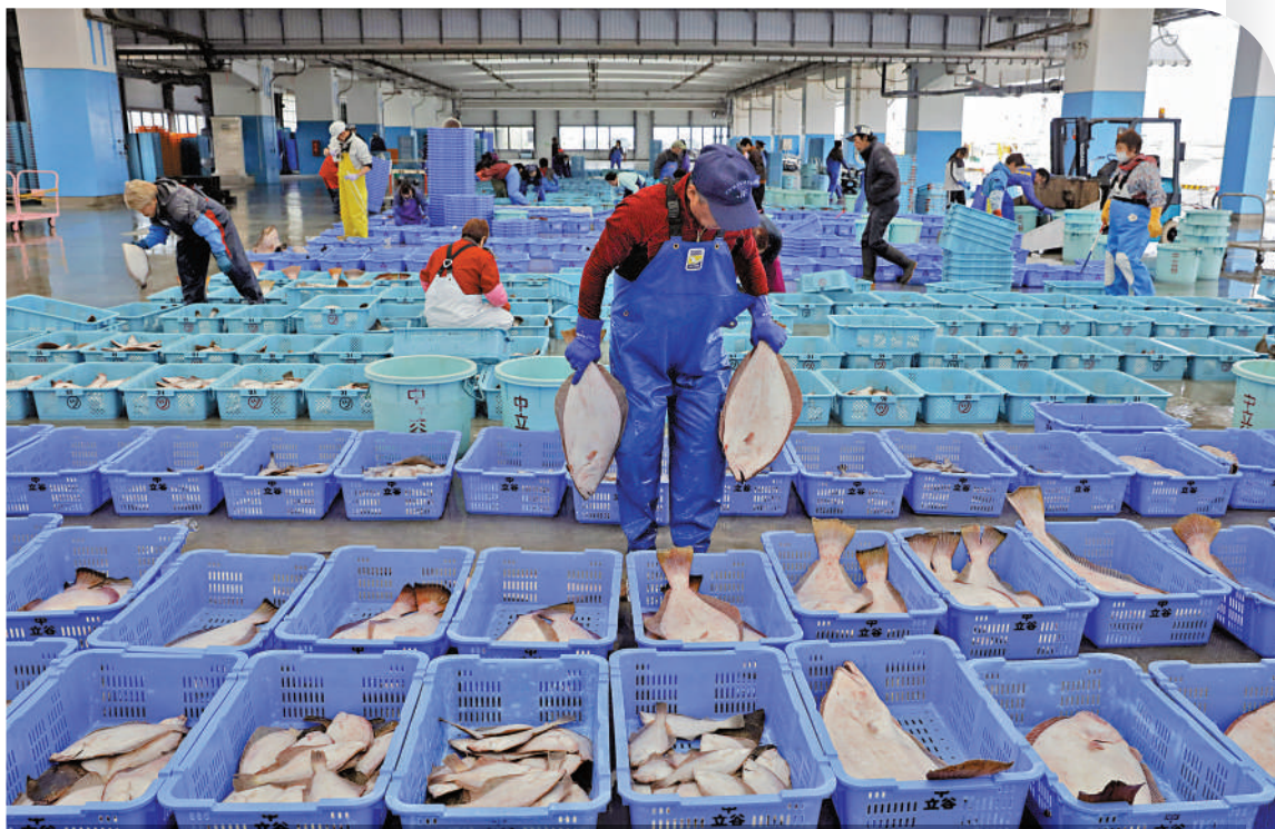
日本福島海產近年多次被發現輻射超標。圖為2019年，日本福島縣相馬市的漁場工人正在加工魚類。

日本福島縣漁業協同組合聯合會當地時間7日宣布，暫停當地海鱸魚上市，原因是在福島縣附近海域捕撈的海鱸魚體內，檢測出放射性物質鉍超標。福島縣水產海洋研究中心表示，從近海捕撈的海鱸魚體內檢測出放射性鉍137的活度已經達到每千克85.5貝克勒爾，超過了該聯合會設定的每千克50貝克勒爾的標準。