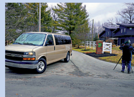
▲美國聯邦調查局10日搜查了前副總統彭斯位於印第安納州的住所。

彭斯是美國2024年大選的潛在競爭者之一。他是繼前總統特朗普和現任總統拜登後，近期第三位被FBI搜查涉密文件的現任或前任總統或者副總統。該事件或導致彭斯參選蒙上陰影。