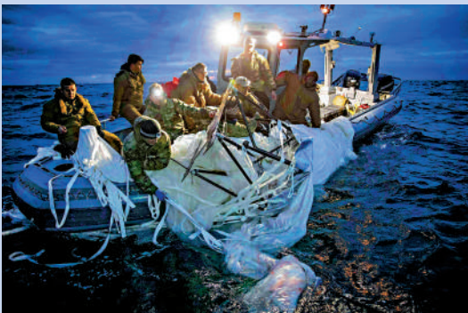
▲美國海軍5日在南卡羅來納州海岸附近回收氣球殘骸。

柯比當日表示，「目前不清楚物體來自什麼地方」，也未證實這是氣球。這個物體在阿拉斯加北部接近加拿大邊境被擊落，當局估計能在冰凍的湖面上找回殘骸。美國4日出動F-22戰機，擊落了一個誤入美國領空的中國民用無人飛艇。中方批評美方反應過度，濫用武力，嚴重違反國際慣例，中方保留作出必要反應權利。