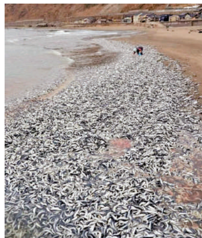
▲日本新潟縣海灘近日滿布死亡的沙甸魚，引發恐慌。

據悉，日本北海道1月也出現了大量沙甸魚被沖上海岸的景象。這些死魚覆蓋鄂霍次克海的海岸線長達幾公里。