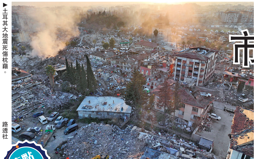
土耳其大地震死傷枕藉。

李家超日前提及，每個地方針對疫情的階段都不一樣，現時本港仍處於冬季流感高峯期，且復常後都會增加人流，因此仍有口罩令。他強調，會聽取專家及醫務衛生局意見，不同專家有不同考慮及時間表，但原則是清晰的，就是以積極考慮取消口罩令為目標。