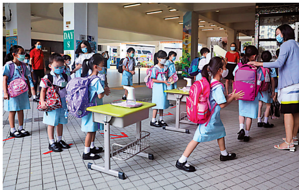
即使取消快測，學校仍要做足衛生及防疫措施，減少傳播。

有外甥女分別就讀中二及中五的家長亦認為，作為家長，不贊成完全取消快測，因疫情雖減退了，但快測仍有它的作用。因此建議可暫時減少快測次數，例如每周一次或兩次，而長假期後也可多做一兩次，這樣似乎可以比較安心。