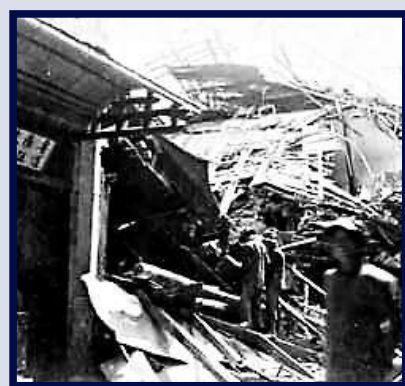
一九一八年汕頭大地震，不少建築物受損。亦有強烈震感，不少建築物受損。