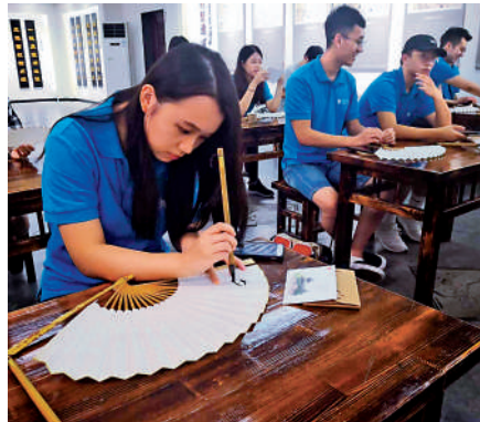
公民科內地考察團，有助學生對祖國的文化和發展有更深入的認識。

參與，蔡若蓮就表示，局方希望所有學生親身到內地體驗，強調考察團屬學習的一部分，不能隨便不參與。如有學生因健康有問題不能參與，需向學校提出申請，而校方亦要保留完整紀錄，以便局方了解、查核。