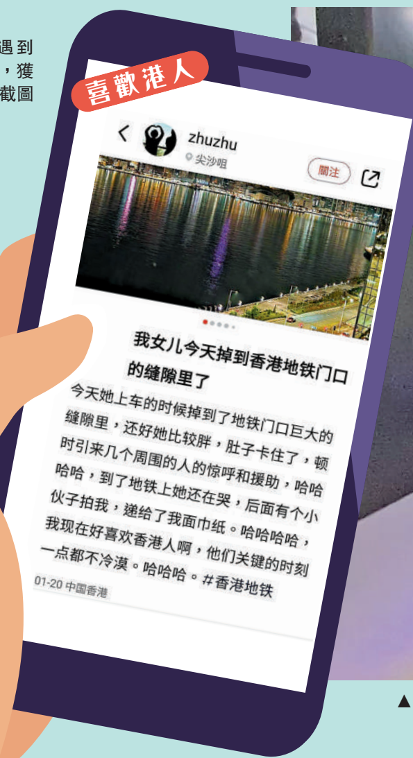
▲港鐵車站部分月台與列車之間的空隙較大，小朋友上落車要格外留神，以免踩空跌落空隙。