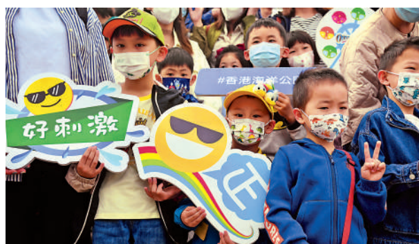
▲昨日海洋公園迎來全面通關後的首個內地對點對點旅行團，團友開心合影。中新社