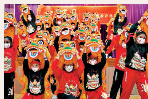
▲教育局舉行華服設計頒獎禮，各同學參與新春表演。

在參賽過程中，探索中華民族的特質、風俗、地理知識與文化，並發揮無限創意，藉繪畫及短片將一件件富民族色彩的