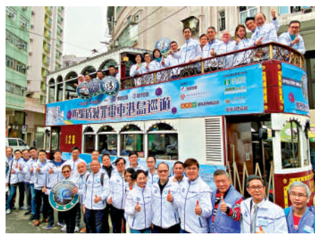
▲警方舉辦電車巡遊，宣傳防騙訊息。

【大公報訊】警方舉辦電車巡遊，宣傳防騙訊息。警務處助理處長、港島總區指揮官郭嘉銓及多名立法會議員，昨日出席「防騙盾滅罪電車港島巡遊」電車啟動禮，沿途派發宣傳單張及講解防騙貼士。