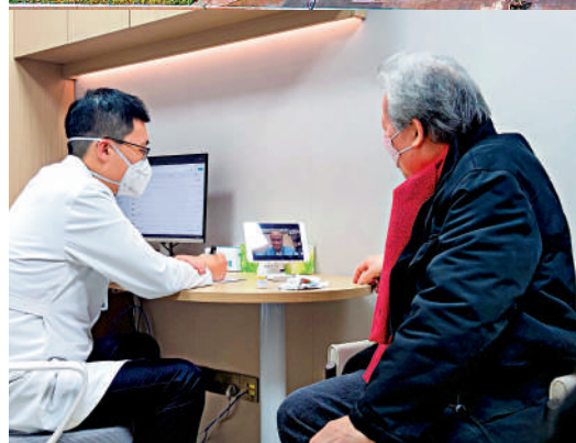
▲港人在港式全科門診就診。大公報記者盧靜怡攝