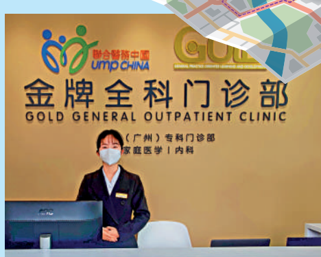
▲位於南沙國際人才港的港式全科門診。

周伯展還提及，廣東省中醫院南沙醫院項目預計今年可以投入服務。香港也有三家大學有中醫學院，即香港大學、香港中文大學、香港浸會大學，2025年，第一家香港全中醫醫院也將誕生。南沙和香港可以考慮在中醫藥方面進行更多交流合作。