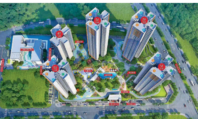
▲天地源·伴山溪谷4幢商品住宅和1幢人才配建房組成。