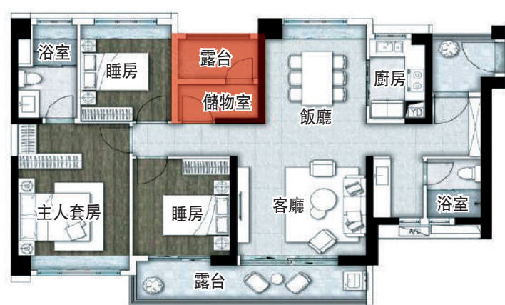
▲亞運城天璣ONE面積126平米三房兩廳連儲物室戶型。