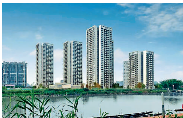
▲中海左岸瀾庭由6幢住宅樓組成，提供974伙。