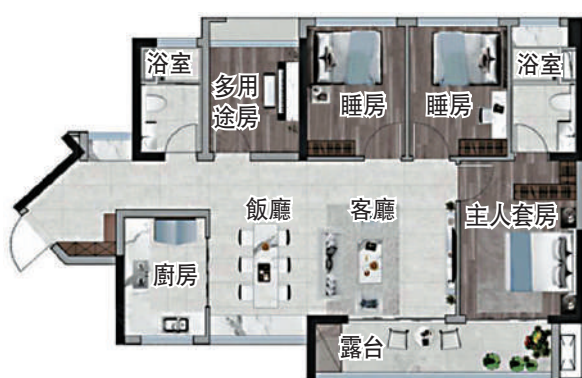
▲天地源·伴山溪谷103平米四房兩廳戶型圖。

至於103平米四房單位，橫廳設計，空間寬敞，客廳位置做了窗台設計，露台則與客廳及主人套房相連；該戶型缺點是有大量的過道面積，而且4個睡房的房門都朝向客廳，房間的私密性稍為遜色。