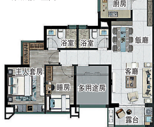
▼中海左岸瀾庭91平米三房兩廳戶型圖。

樓盤由於鄰近亞運城，交通、教育、商業配套等資源也與亞運城相若。交通方面，由地鐵4號線海傍站出發，僅3站即到高鐵路慶盛站，9分鐘至東莞，25分鐘到深圳。屋苑距離蓮花山港口約3公里，每天各有4個班次往返香港國際機場及香港中港城。項目門口有公車站亞運城總站，通往海傍地鐵站、番禺廣場、海島島，另開通社區穿梭巴士接駁地鐵。