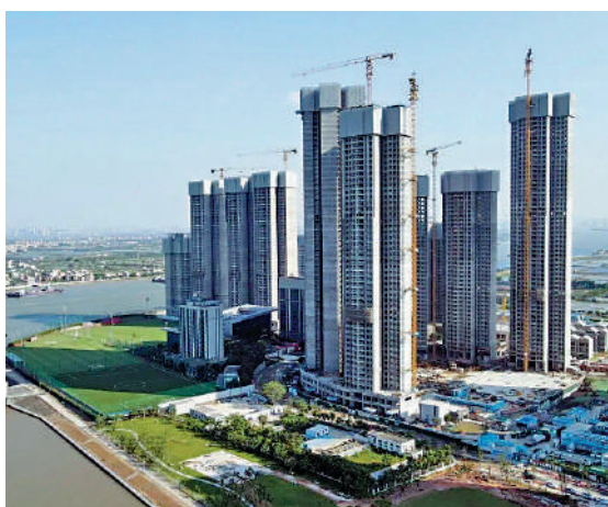
▲亞運城天璣ONE是亞運城新推出的項目，最大賣點是望向江景。

米戶型為兩房兩廳連儲物室間隔，戶型方正，設入戶花園，保障私密性的同時，也能結合需求作一些改造。103平米單位同為兩房兩廳連儲物室設計，睡房及客廳朝南，光猛舒適，主人房則以套房設計。