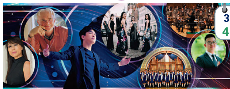
3月4日 繁聲流動——管弦與合唱音樂盛會 曲目： 約翰·亞當斯 《尼克遜在中國》選段 約翰·亞當斯 《絕對的玩笑》 陳銀淑 《星星的孩子》