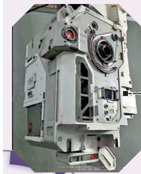
3 無人機干擾槍(深圳)