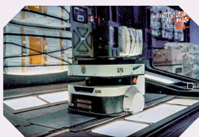
5 行星發動機機庫的移動機械人(深圳)