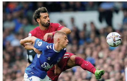
▲沙拿（後）近況低沉，恐無力攻破愛華頓大門。

【大公報訊】綜合sportsmole、天空體育報道：英超周二凌晨上演「默西塞德郡打吡」，利物浦主場迎戰愛華頓，兩隊目前皆陷於困境，前者今年聯賽仍未「開齋」，後者就深受降班威脅。利物浦即使主場亦無可勝把握，愛華頓就乘上仗勇挫阿仙奴之勇再爭分數，不妨博「讓球主客和」愛華頓[+1]的讓客。（NOW621及611台周二凌晨4時直播）