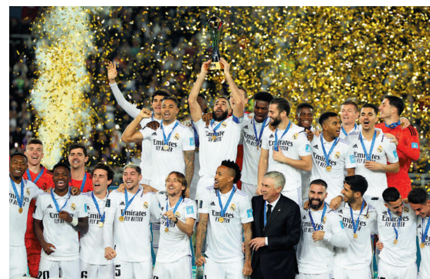
皇家馬德里昨晨在摩洛哥舉行的世冠盃決賽，憑鋒線3子包辦5個入球，以5：3擊敗沙特阿拉伯對手希拉爾，把自己保持的奪標紀錄增至5次，亦為之後在西甲追趕巴塞隆拿、歐聯16強再遇利物浦增添信心。