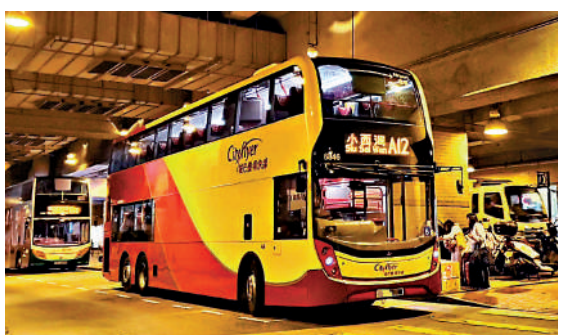
▲被指班次疏落的機場巴士A12線。