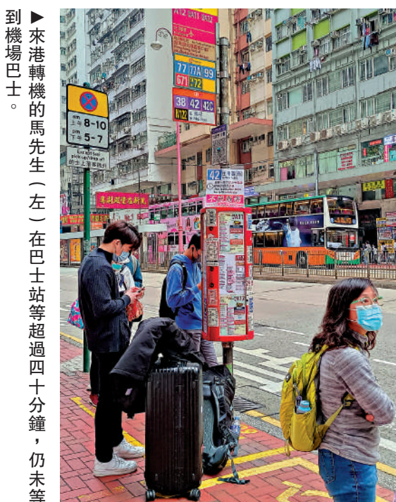
▲來港轉機的馬先生（左）在巴士站等超過四十分鐘，仍未等到機場巴士。