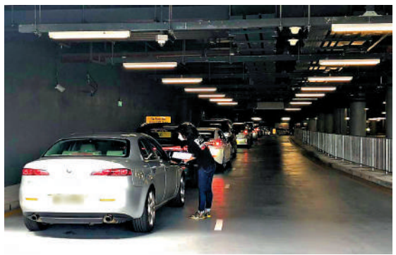
▲香園圍／蓮塘口岸車位預約系統出錯，超額預訂，車輛無法泊入。

政府產業署表示，造成車位不足的原因包括大量車輛未有按預約時限離開，職員表示，車輛逾期停泊後就按時租計算，首兩小時收費10元，之後每小時收15元，目前不知道停車場內有多少逾期停泊未離開的車輛。