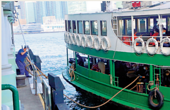
▲天星小輪拋繩泊岸，水手大顯身手。