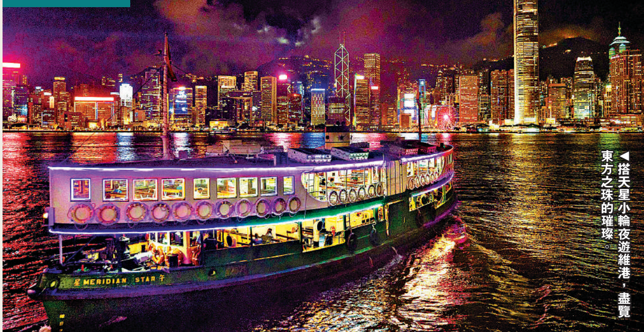
搭天星小輪夜遊維港，盡覽東方之珠的璀璨。