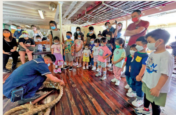
▲天星小輪舉辦小水手親子體驗遊，讓小朋友上船學習航海知識。