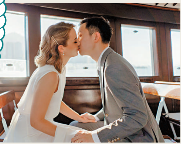
▲船上締結不少美好姻緣。