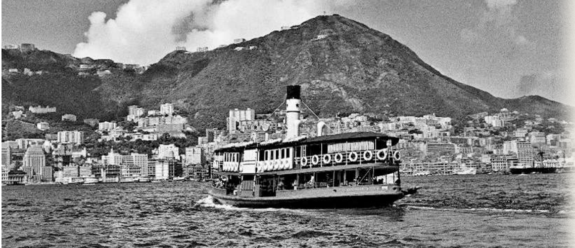
▲攝於50年代的天星小輪和中環遠景，是本港已故著名攝影師李福志得意之作。