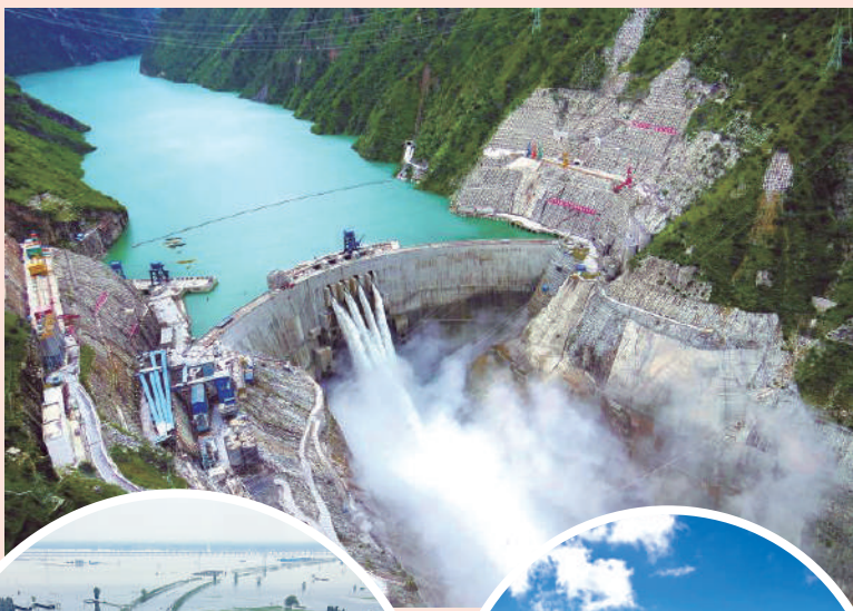
◀水力發電是不少地區重要的電力來源。

乾旱提醒著我們珍惜水資源，滴水成河尚為不易，珍惜自然界的饋贈。涓涓細流匯聚在一起，成為供給我們生活的源泉。或許那一滴水、那一條溪流曾經流過高山，涉過險灘，沖過懸崖，千回百轉才走到我們身邊。含情脈脈的水流，靜若處子的溪流，換來了田野裏的碩果纍纍，換來了萬頃良田，更換來了人們的豐衣足食fēng yī zú shí、安居樂業ān jū lè yè。水，涵養了所有的生命，包容了世間的萬