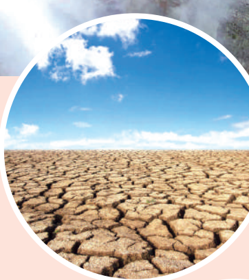
◀若降雨量稀少，大地將出現乾旱龜裂的情況，影響巨大。