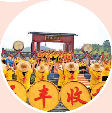
▲風調雨順，將迎來豐收季節。

物，激勵了人類文明不斷向前。水匯到海裏，給人的氣候帶來了許多滋潤。真所謂，海納百川，有容乃大。