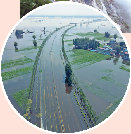
▲若雨水太多，將形成洪災。