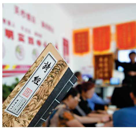
▲詩經孕育了中國人的傳統文化，對現今社會仍發揮深遠影響力。

來釀成春熟的美酒，喝完以助延年益壽。」可見，新年不可無酒。經過一年的辛勞和繁忙，用豐收的稻穀釀成美酒暢飲，慶賀新年，祝福長壽，充滿迎接新歲的歡欣喜悅。