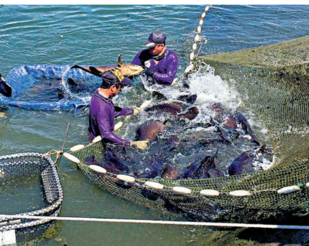
▼台灣石斑魚的外銷市場主要是大陸。資料圖片