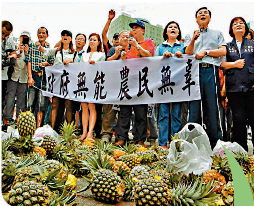
▲台灣各界人士舉行集會，批評台當局無力幫助農民開拓銷路。資料圖片

對於台灣農漁產品頻頻出現問題，民進黨當局不是幫助農民改善品質，而是把相關議題政治化，推卸責任，只會用污蔑大陸這一個老套路來迴避自身責任，其背後癥結顯而易見：民進黨當局為一己政治私利，拒不承認「九二共識」，堵死了兩岸交流和商談的坦途，台灣農漁民不過是其操弄民粹的「炮灰」。