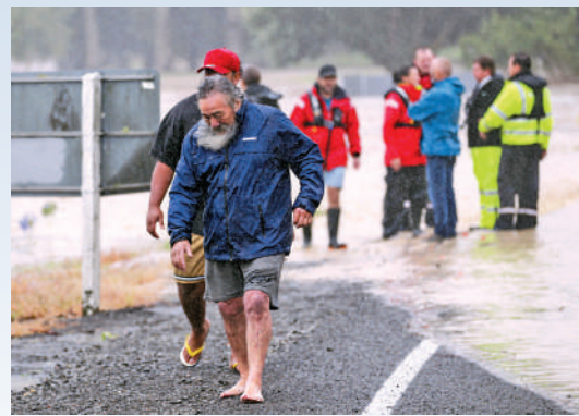
▲奧克蘭黑斯廷斯的民眾14日徒步疏散。

氣象學家們早就預言，全球升溫將導致更頻繁更極端的氣象災害。新西蘭北島剛剛經歷暴雨，數據顯示，今年奧克蘭在短短45天內的降水量就達到了過去一年總降水量的48%。