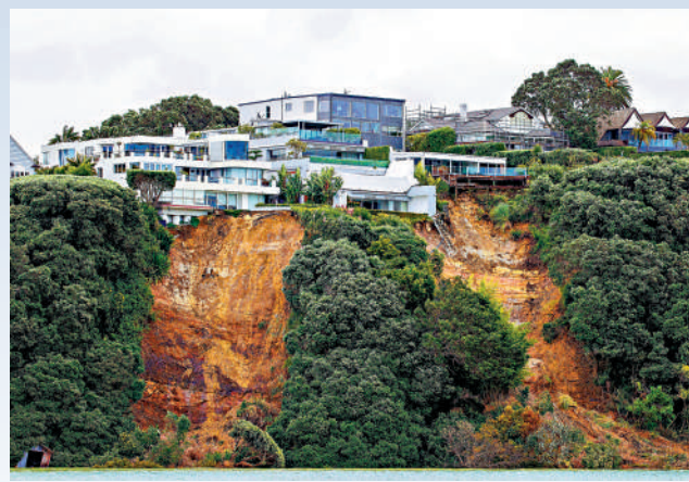
▲颶風造成山泥傾瀉，奧克蘭一所建在山崖邊的房子處於險境。