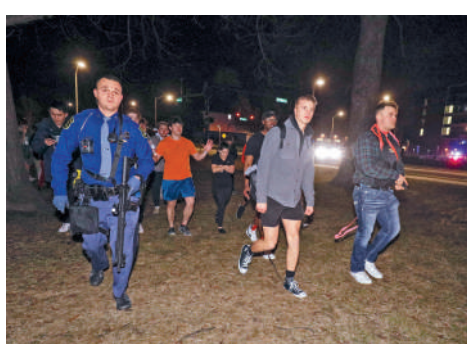
▲槍擊案發生後，學生被警方帶到安全區域。

其死於「自己造成的槍傷」。警方稱，該男子與密歇根州立大學沒有任何關係，作案動機不明。