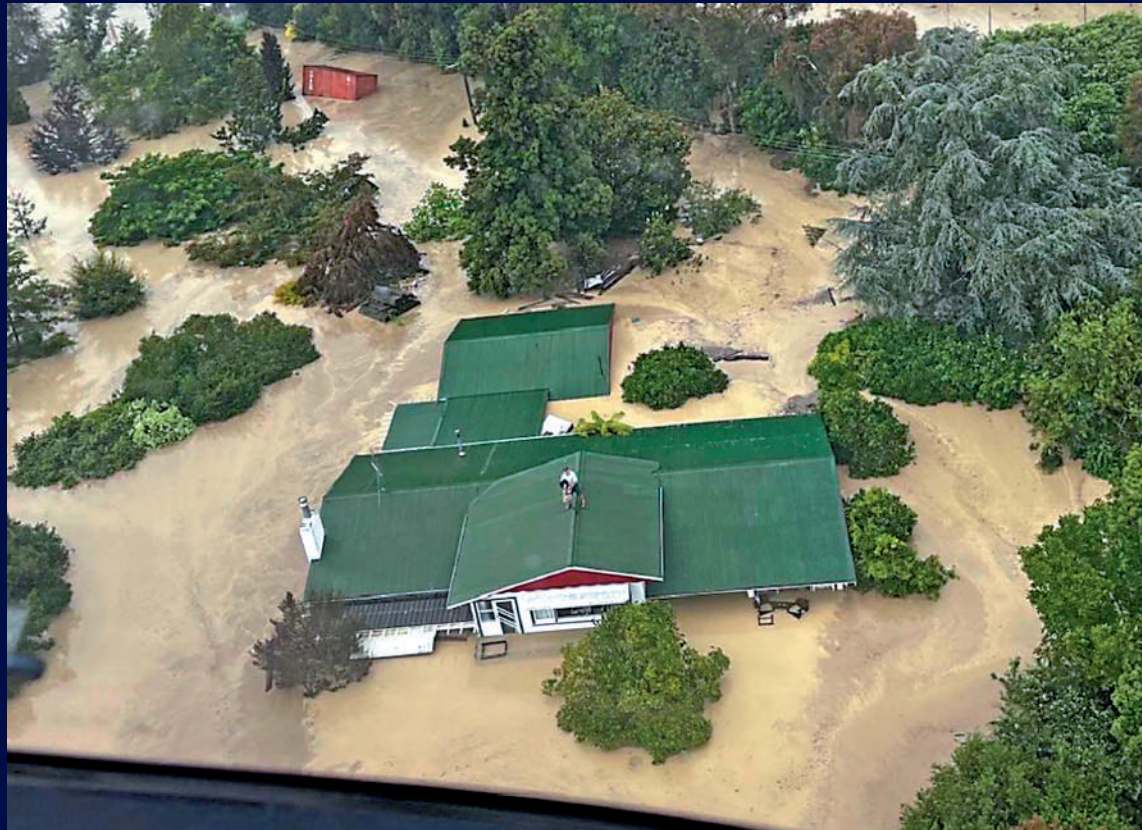
▲颶風「加布麗埃爾」侵襲帶來的暴雨淹沒房屋，北島埃斯克谷民眾14日被困屋頂。