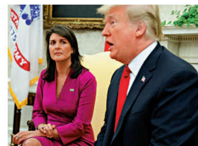
▲黑莉14日宣布參選，挑戰特朗普（右）。資料圖片

未來幾個月將有至少6名知名共和黨人加入2024年總統候選人提名角逐。佛州州長德桑蒂斯、前副總統彭斯，以及前國務卿蓬佩奧都有可能成為強有力的競爭者。