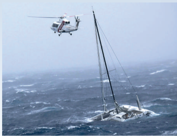
▲直升機14日在北島豪拉基灣發現一艘遇險遊艇，遊艇上有一名水手。

氣象部門14日稱，「加布麗埃爾」將以每小時140公里的風速，向東南方向移動，為首都惠靈頓和南島帶來狂風暴雨。預計未來24小時雨量超過20厘米，沿岸地區巨浪達11米高。最早要到當地時間2月15日下午，颶風才會逐漸離開新西蘭境內。