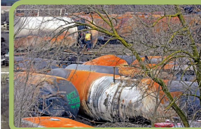
▲工作人員9日在對脫軌列車進行清理。

【大公報訊】綜合《衛報》、《紐約郵報》、Insider 報道：美國俄亥俄州火車脫軌事故造成的影響範圍持續擴大，附近區域出現大量家禽及魚類死亡，有民眾眼睛、喉嚨等處出現灼痛感，嬰兒出現呼吸系統問題，但當局卻表示被疏散的居民已可以安全返回家中。有專家認為，此次洩漏事件無異於「用化學物質摧毀一個城鎮」，5年至20年後，當地可能會出現很多癌症患者。