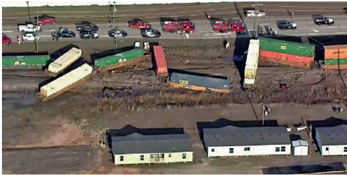
▲得州一輛載有化學品的火車13日與貨車相撞，導致車廂脫軌。

另外，南卡羅來納州恩諾瑞市14日發生另一起火車車廂脫軌事故。美國交通統計局數據顯示，1990到2021年，美國共發生54539次火車脫軌事故，平均每年1704次。