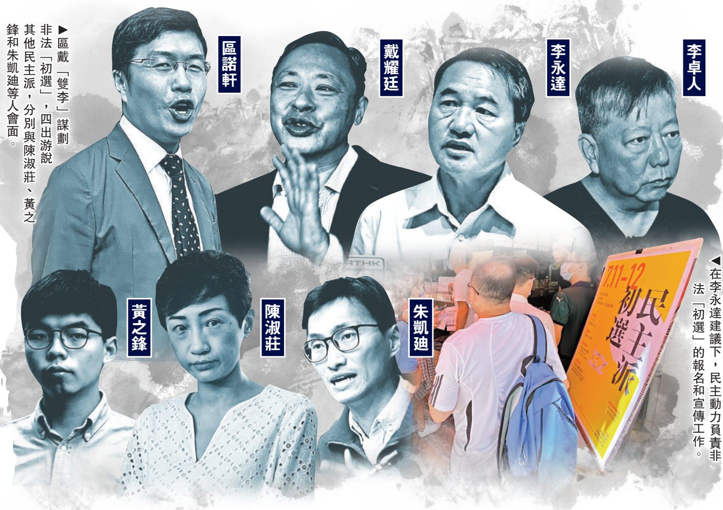
在李永達建議下，民主動力負責非法「初選」的報名和宣傳工作。

區諾軒「雙李」謀劃非法「初選」，四出游說其他民主派，分別與陳淑莊、黃之鋒和朱凱迪等人會面。