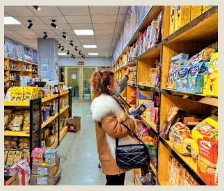
▲俄羅斯食品成為中國網民的新寵。

隨着線上經營競爭越趨激烈，綏芬河的跨境電商逐步由單打獨鬥轉向抱團取暖。截至目前，已有來自本地及周邊區域的200餘名網絡主播在羅斯帝國跨境電商直播基地網銷進口商品和地方特色產品。