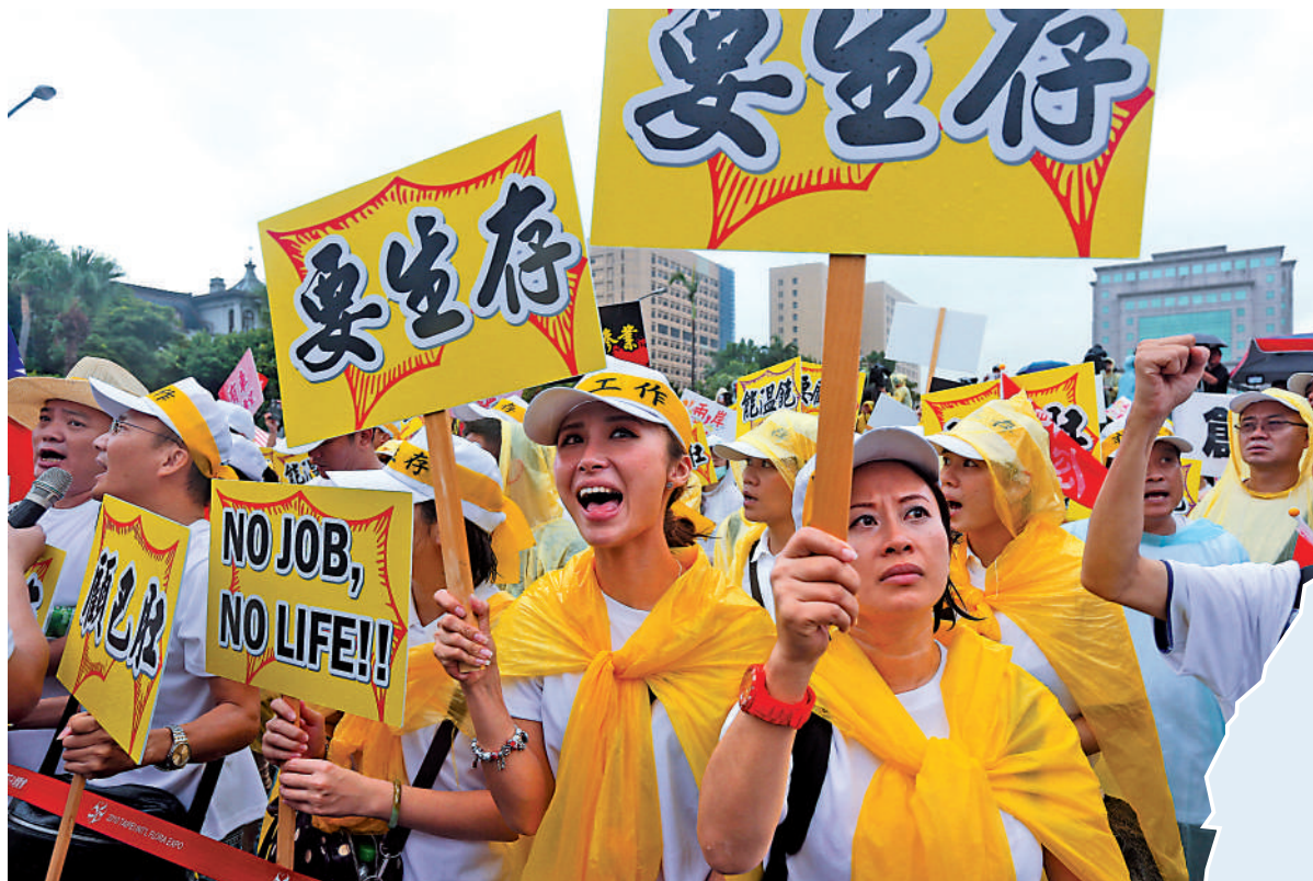
▲台灣旅遊業者舉行集會，呼籲民進黨當局改善兩岸關係，重新吸引陸客赴台觀光。資料圖片

此外，台媒評論指出，即使蔡英文、賴清德都說希望緩和兩岸對立，但民進黨和親綠媒體仍無法拋棄「抗中情結」，網軍更是「逢中必反」。如果民進黨拒絕更務實面對兩岸情勢，終究走不出和對岸的零和對抗。在開放港澳自由後，如何有序開放陸客來台，是下一步兩岸民間交流恢復的觀察指標。