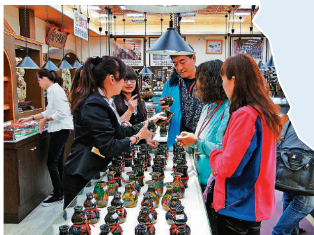
▲陸客消費力強，受到台灣旅遊業歡迎。資料圖片